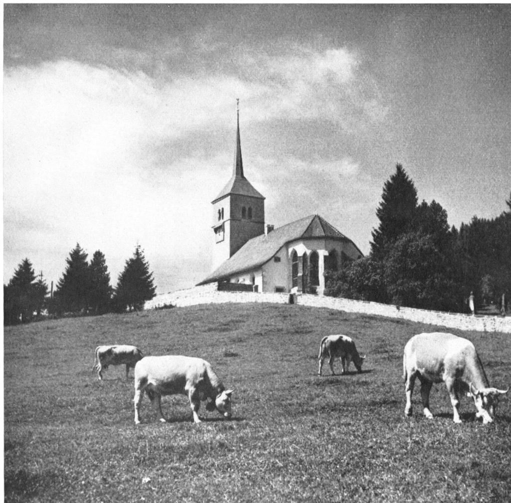
L'édifice s'élève sur une éminence, un peu à l'écart du village, dans une altière solitude.