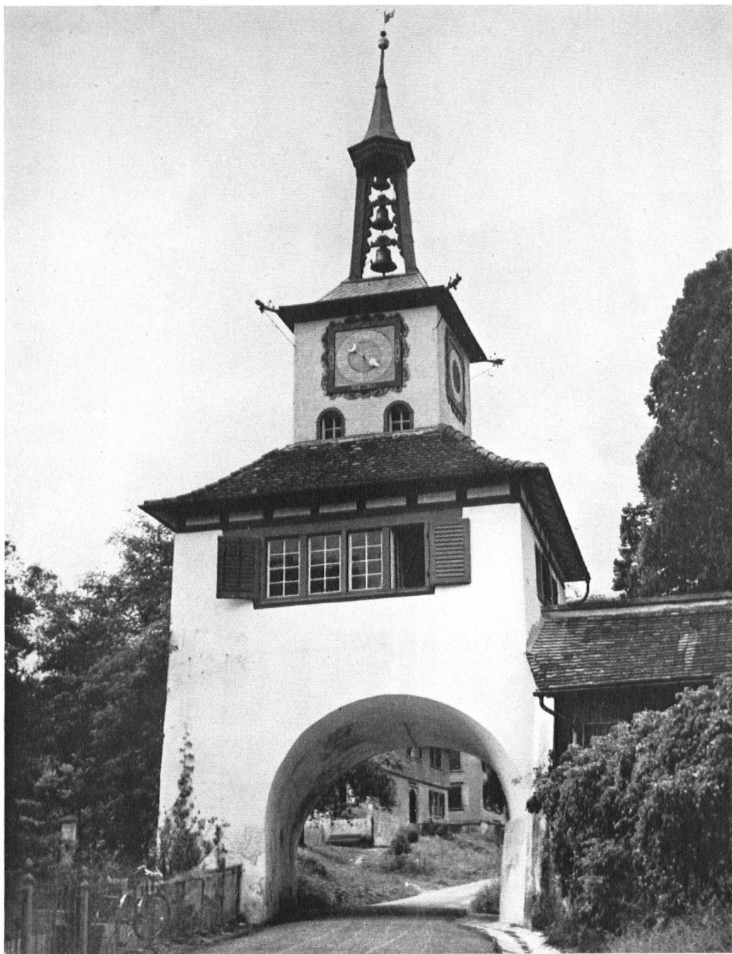
Le bourg minuscule de Hauptwil possède encore sa porte d'enceinte qu'il faut franchir pour accéder au château des Gonzenbach. L'horloge du maître zuricois Félix Bachofen n'a point démerité depuis l'année 1672.