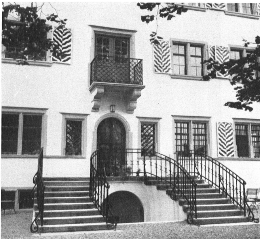
Le perron d'entrée et . . .