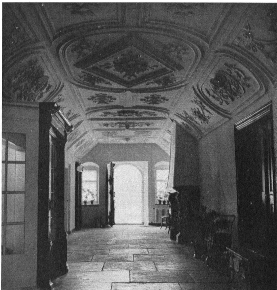
le hall du rez-de-chaussée, orné de stucs.