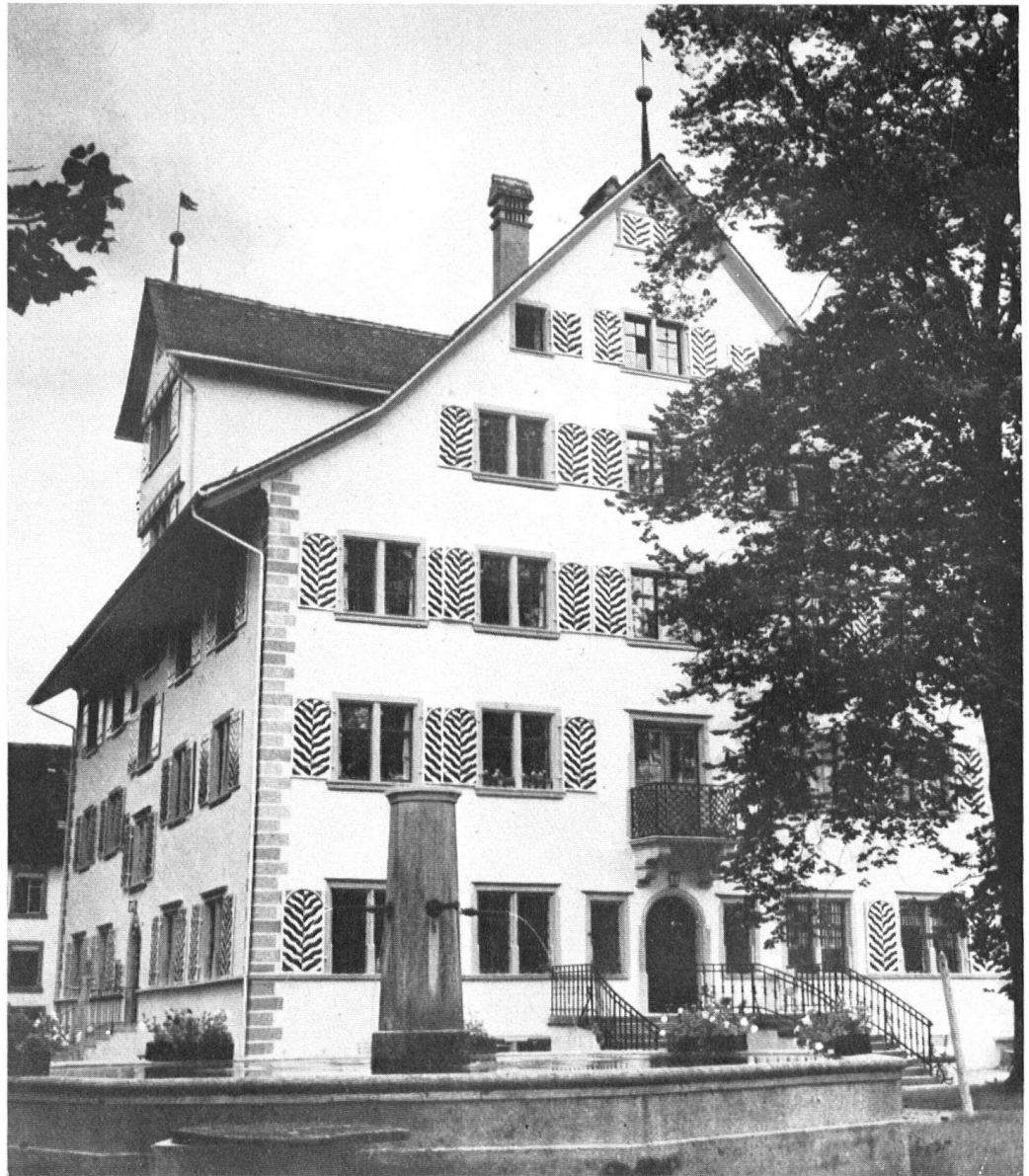
La maison seigneuriale où vécut Frédéric Hölderlin.

la fin de sa vie à Meersburg sur le lac de Constance. Toutefois le plus célèbre des habitants fut bien le poète Frédéric Hölderlin (1770—1843) avant que son génie eût été la proie de la folie.