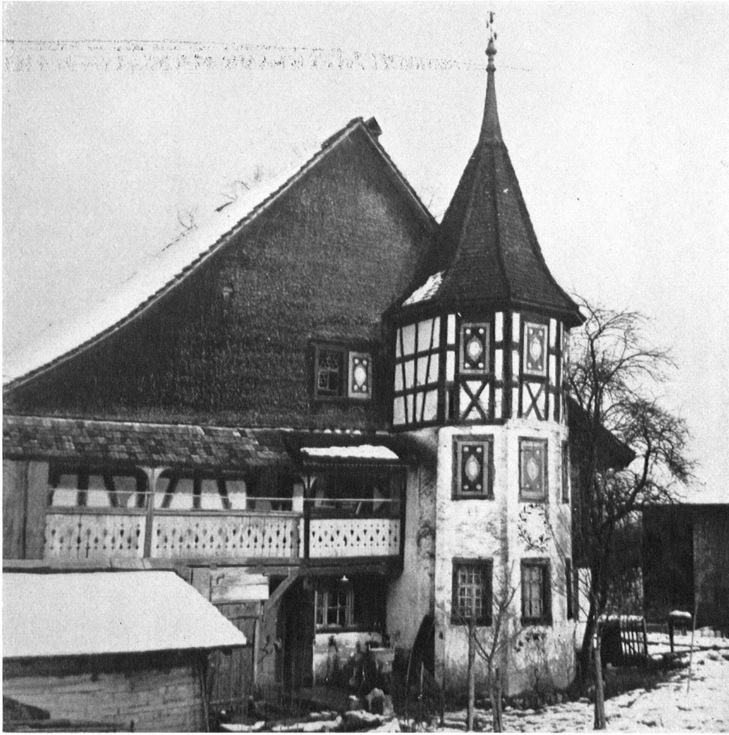
La « Maison du Docteur » à Hofstetten près d'Elgg (canton de Zurich), telle qu'elle était avant la restauration.