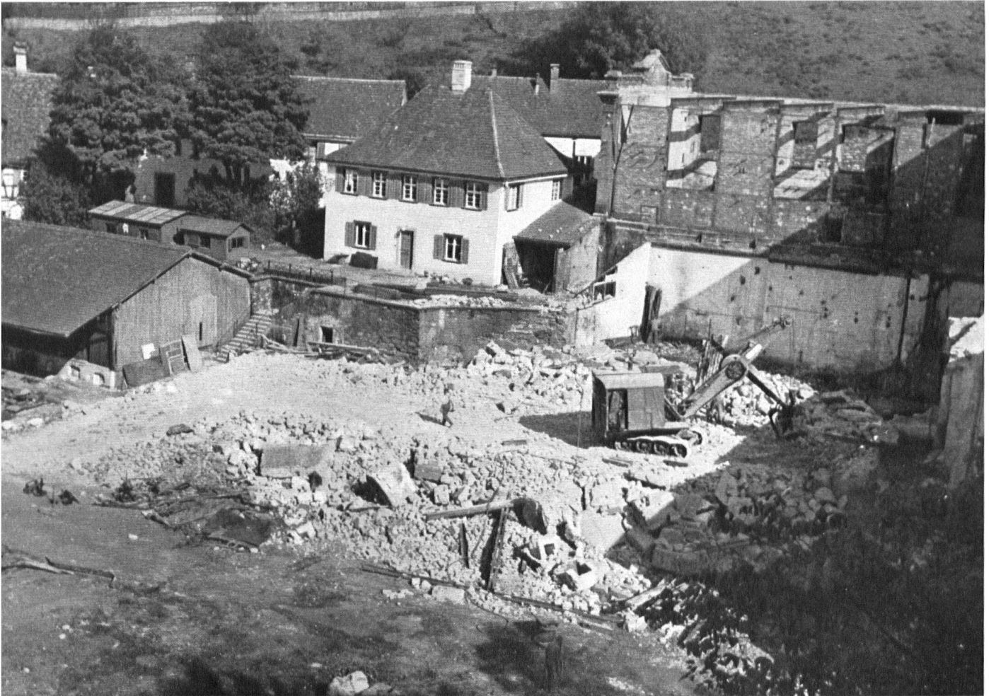
Vor dem Hause links, wo der Abbruch früher begann, ist die gärtnerische Verwandlung bereits vollzogen.