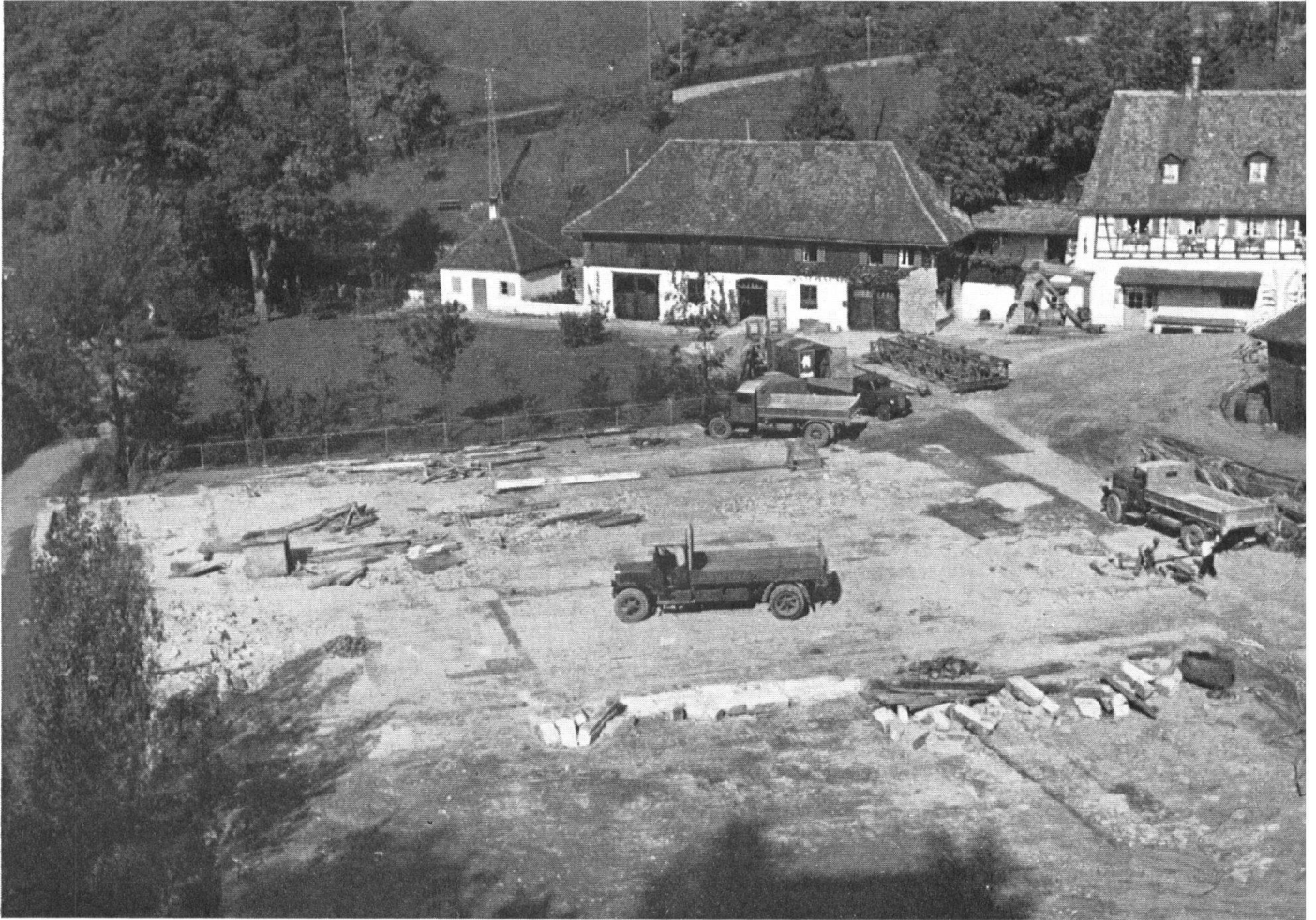
Schon sind die Fabrikanlagen verschwunden, und die hinter ihnen verborgene reizende alte Mühle und traulichen Wohnhäuser sind wieder zum Vorschein gekommen.