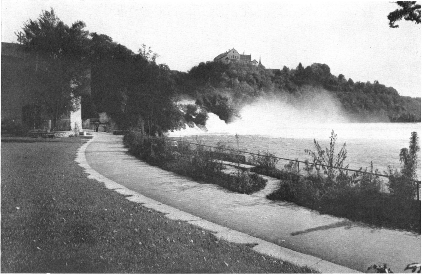
Blick vom fertiggestellten Anfang der Grünanlage gegen den Rheinfall. Eine fast unwahrscheinlich anmutende Verbesserung. Links oben ist der Beginn des inzwischen ebenfalls verschwundenen Haupthausens der Fabrikbauten zu sehen.