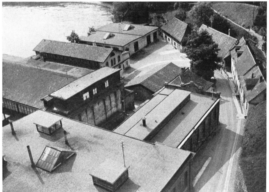
Die nun abgetragenen Fabrikgebäude, rechts im Bild die bis jetzt versteckte Zeile der alten Häuser.