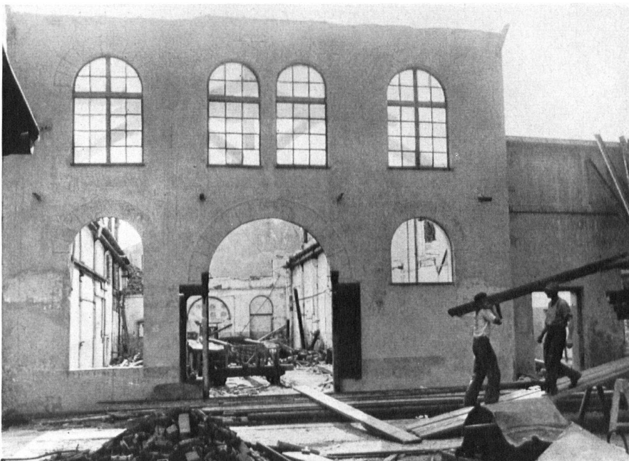
Die Fabriken im Abbruch! 40 000 m 3 umbauten Raumes verschwanden – 4000 m 3 Schutt wurden planiert oder versenkt.