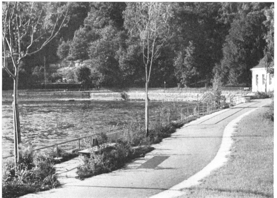
Blick von den neuen Anlagen stromabwärts.