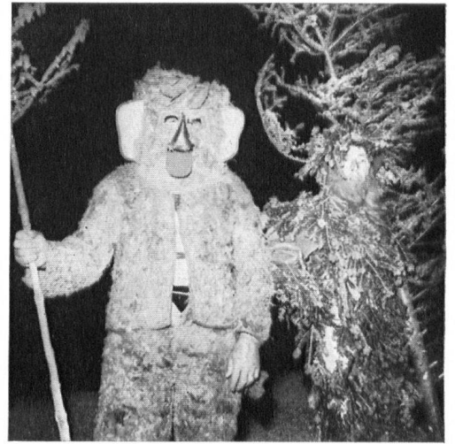
Wildmänner tauchen aus der Nacht auf und haben dem Landesobmann brennende Fackeln übergeben. Er legt das Feuer an den Holzstoß, und die letzten Überreste des Hotels Regina Montium gehen in Flammen auf.

Kulmhaus hinuntergezügelt, wo man ihnen vor Wind und Regen geschützte kleine Läden einbaut. Und wie angenehm es sich auf den sanftgezogenen neuen Wegen wandelt, wie schön der Blick über die neuen hölzernen Alpzäune hinunter in die Tiefe sich auftut!