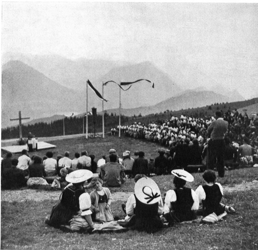
Tel il est apparu lors de l'assemblée du 19 juin 1955.