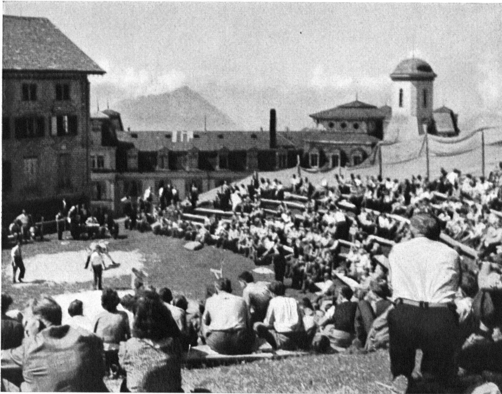
Tel était le cadre où, naguère encore, avaient lieu les fêtes annuelles de lutte.