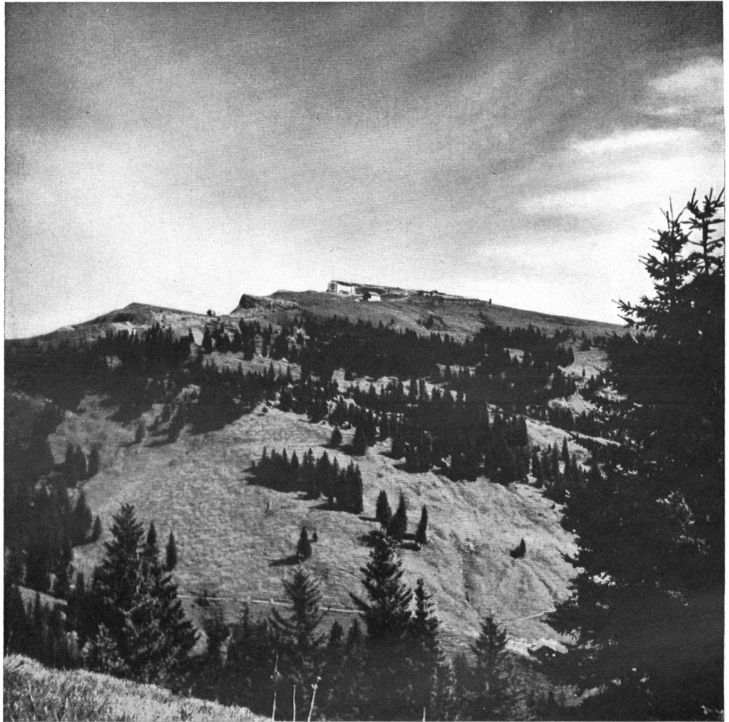
La montagne vue du sud-ouest. Le nouvel hôtel ne lui fait plus vergogne.