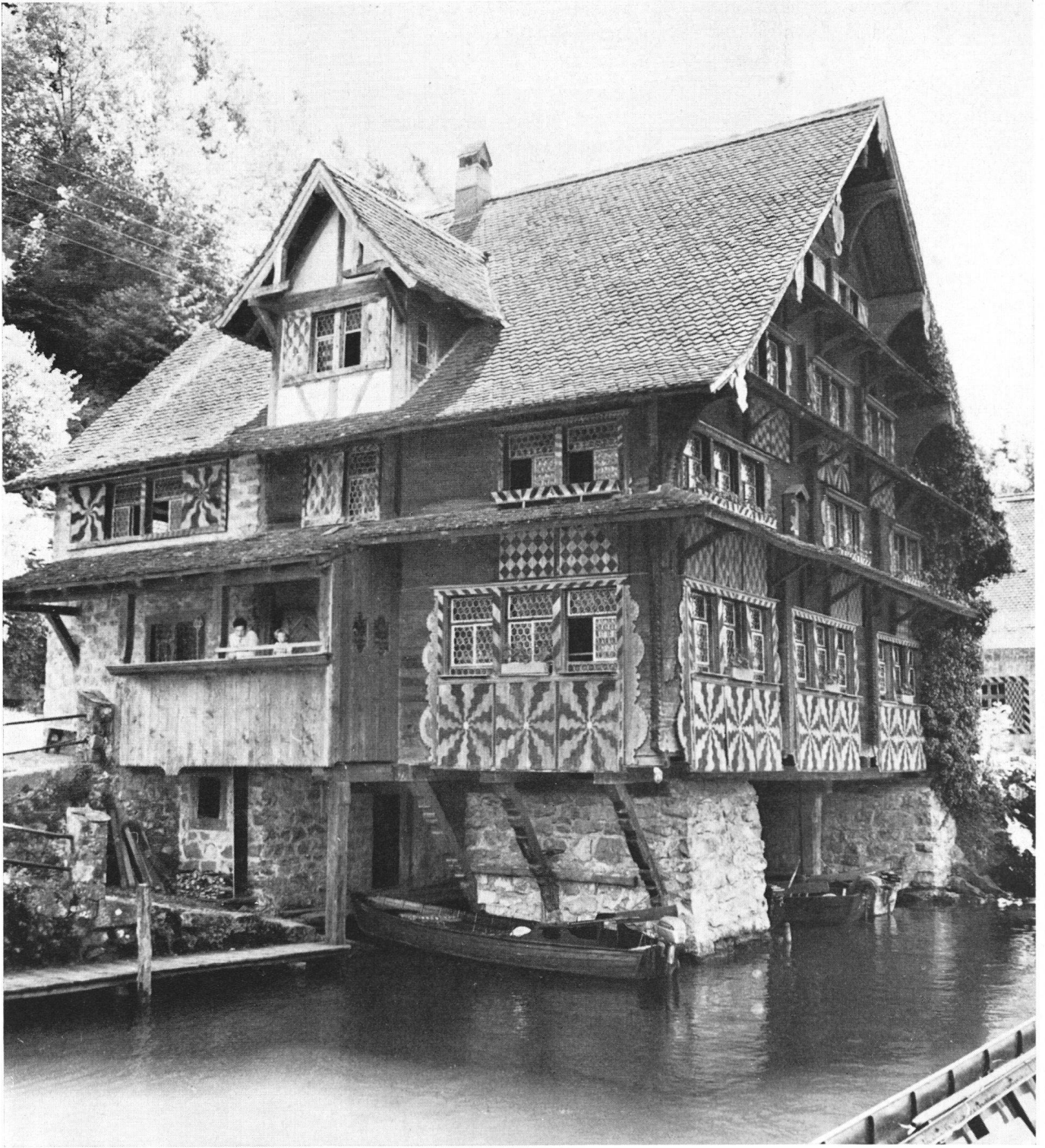
Depuis la rénovation de 1903, les moellons qui soutiennent la Maison des bateliers ont magnifiquement résisté aux forces naturelles. Il n'en est pas de même de toutes les parties de l'édifice. C'est un maître d'école zuricois, parmi nos plus fidèles collaborateurs, qui attirera notre attention sur la nécessité d'une intervention de l'Ecu d'or.