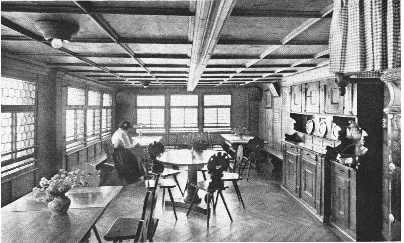
La grande salle lambrissée du rez-de-chaussée.

Au cours des ans, il semble que l'importance de la maison se soit accrue. Un document de 1714 montre tout ce que l'on exigeait de l'aubergiste du « Treib ». Droits de pacage, exploitation de la forêt, tout cela est précisé, mais surtout ses devoirs à l'égard des navigateurs. Les droits de passage sont soumis à des conditions précises, dont bénéficiaient avant tout les ressortissants de la commune: « Quand les montagnards veulent se rendre à Brunnen pour le service divin, ou transporter du pain, de la farine ou du sel, le tenancier doit mettre un bateau à leur disposition pour l'aller et le retour, gratuitement. » Ce cahier des charges du « Treib », dont l'original se trouve aux archives de Seelisberg, ne comprend pas moins de 27 articles.