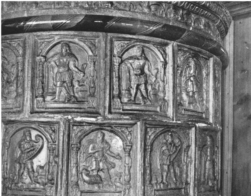
Le magnifique poêle de la grande salle, en catelles d'un vert sombre, raconte l'Histoire sainte. On y cherche vainement une date. Mais un autre tout pareil, sis dans la maison du Grutli, est daté de 1601.