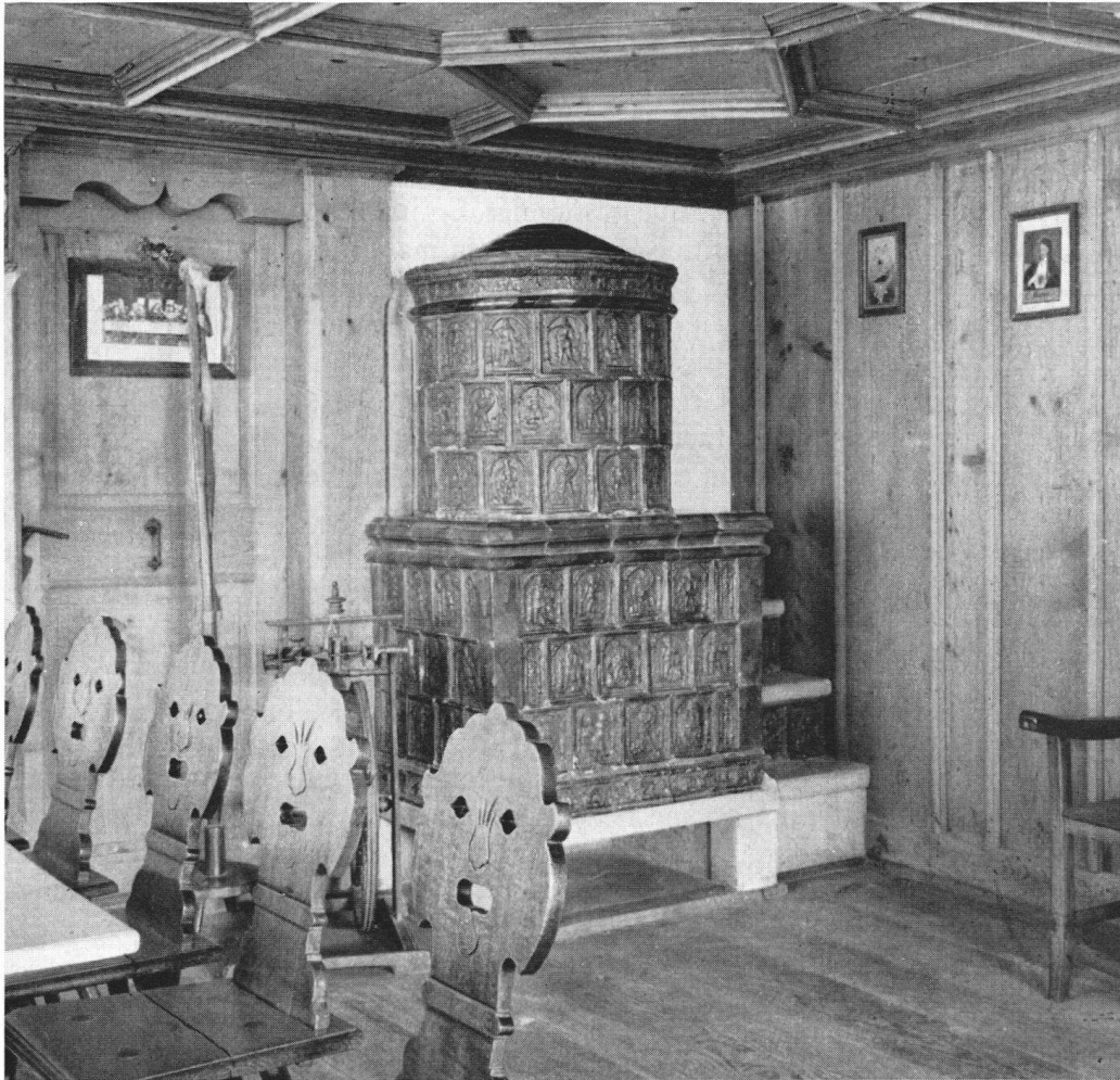
La « salle des délibérations », au premier étage, où, selon la tradition, les représentants des petits cantons se sont réunis 72 fois pour discuter des affaires publiques.