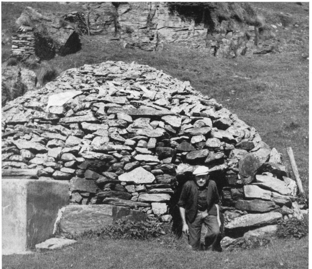
Sur l'alpage, à quelque distance de la chapelle, l'une des huttes voûtées en pierres sèches, semblables à des demeures de l'âge préhistorique.