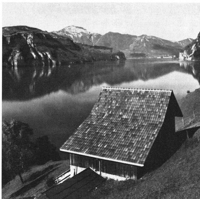
Das Wiesengelände im 'äußeren Tellen' mit der kleinen Scheune, die anno 1941 auf die 650-Jahrfeier der Eidgenossenschaft mit Ziegeln bedacht wurde (siehe Text).

schon im Entstehen, als der Gemeinderat von Sisikon mit bemerkenswertem Mute den Dorfagnaten am Wickel nahm, feststellte, daß weder Pläne noch gar eine Baubewilligung vorlagen, und ihm das Weiterbauen verwehrte mit der Begründung, das weitere Umgelände der Tellskapelle, d. h. das ganze Gebiet des 'äußeren und inneren Tellen' gehöre zu den vaterländischen Gedenkstätten, sei also schutzwürdig und dürfe nicht überbaut werden.