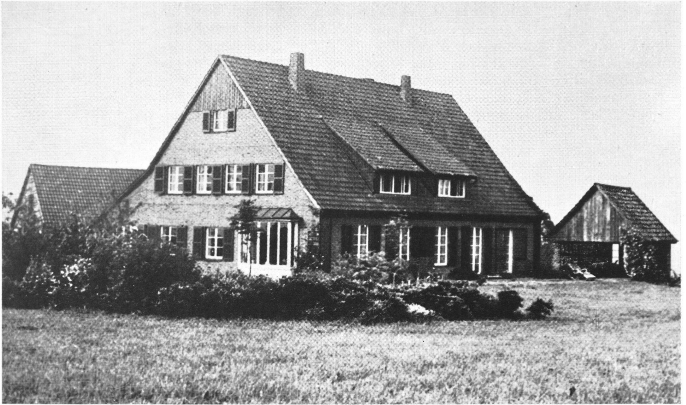
Landhaus in Westfalen, 1954.