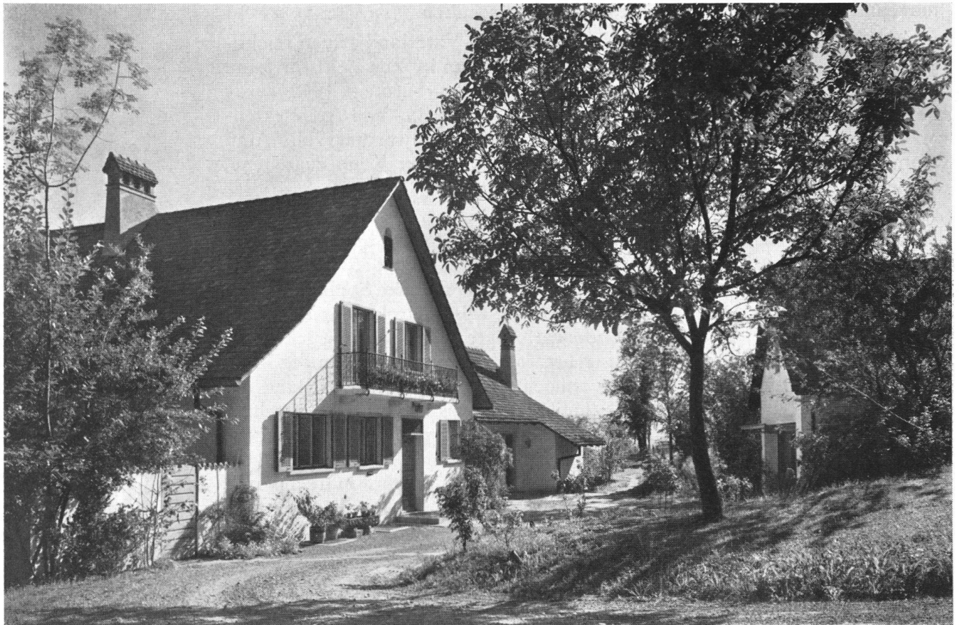
Landhaus über dem Zürichsee, 1948.