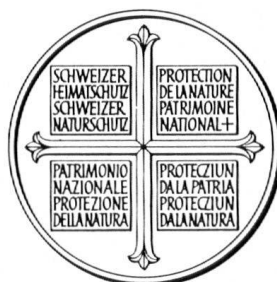
Der Taler 1964 von Carl Fischer (Herrliberg)