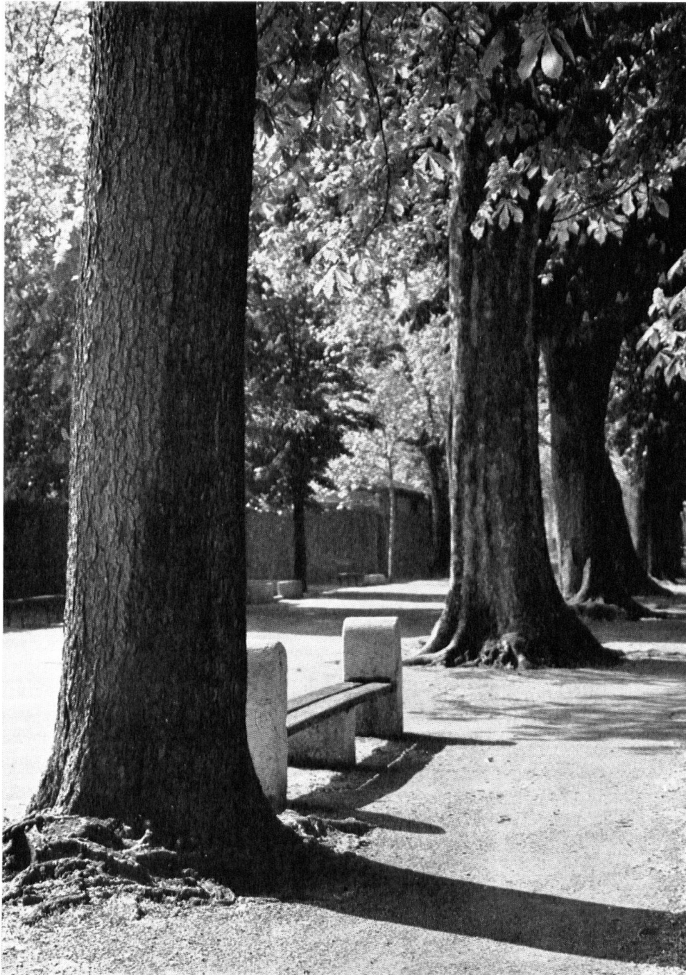
« Les Promenades ». Le long du canal récemment supprimé qui servait d'enceinte à Carouge du côté de l'ouest et du nord, on planta des peupliers en 1784. Ils furent abattus sous l'Empire, lors d'un hiver rigoureux. Les remplacèrent deux rangs de platanes et de marronniers qui, superbes, subsistent.

banque sur la place de la Collégiale de Bellinzona (encadrée de maisons patriciennes baroques) nous incite à la prudence.