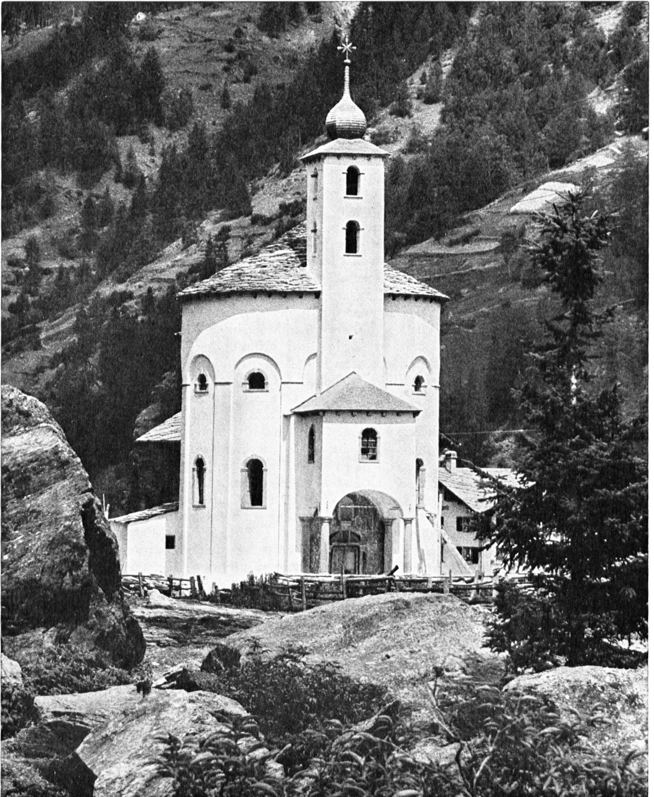
Die Rundkirche in Saas-Balen nach der Erneuerung in den Jahren 1963/64.