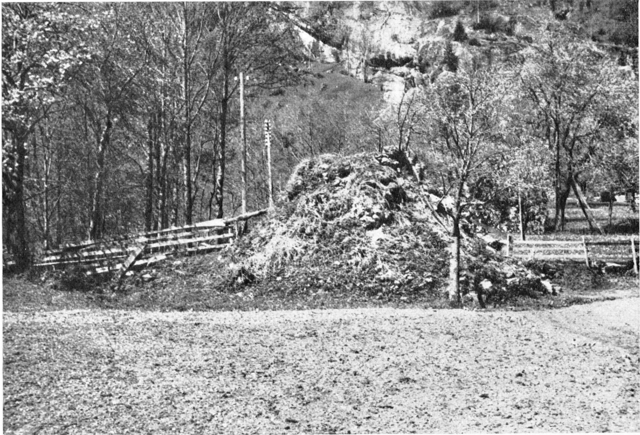
Einem Schutthügel ähnlich, erhoben sich die Reste des Schmelzofens vor der Restaurierung. Unter dem Boden, bis in 3 m Tiefe, war die Umfassungsmauer jedoch vollkommen intakt, ebenso der einstige Ofenschacht in der Mitte.