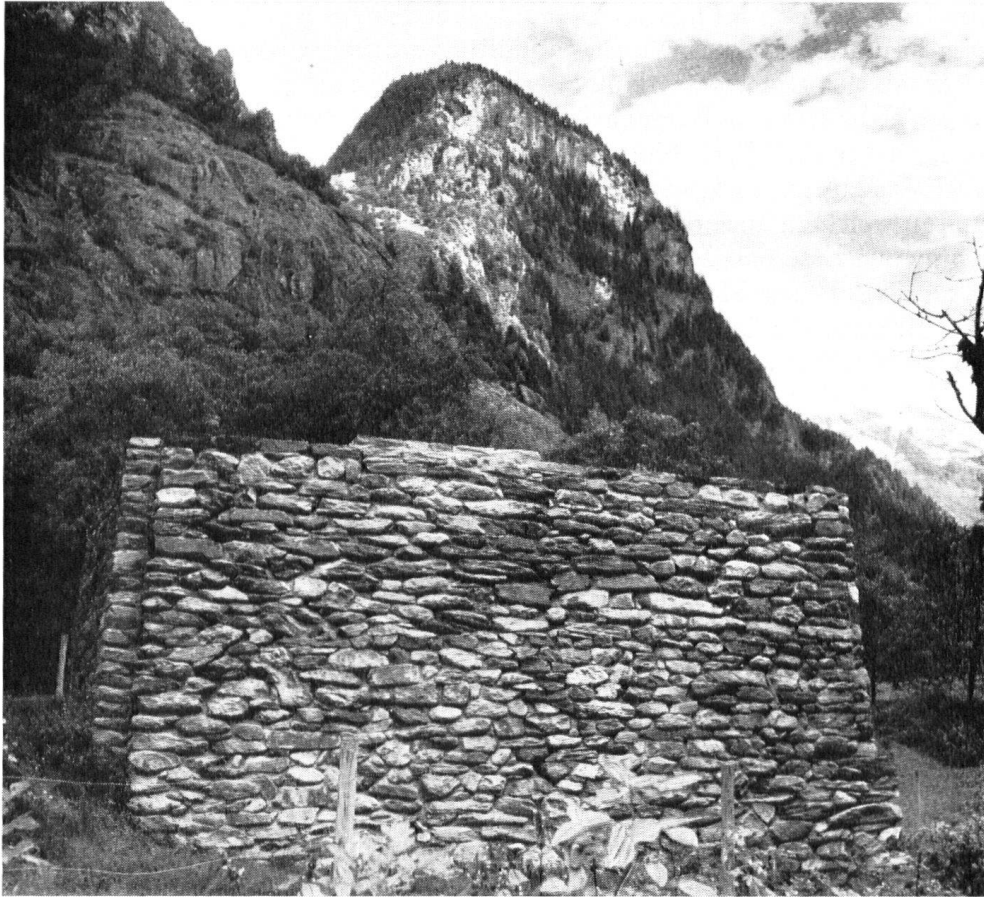
Der erneuerte Schmelzofen in Bristen-Obermatt. Blick zum Geschel bei der Golzernalp.