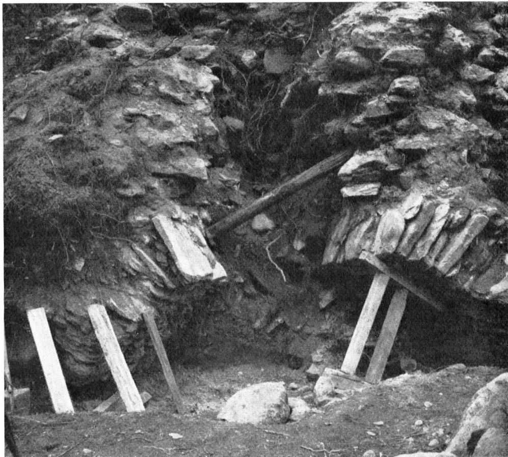
Die Abstichöffnung, wie sie sich bei der Freilegung präsentierte.