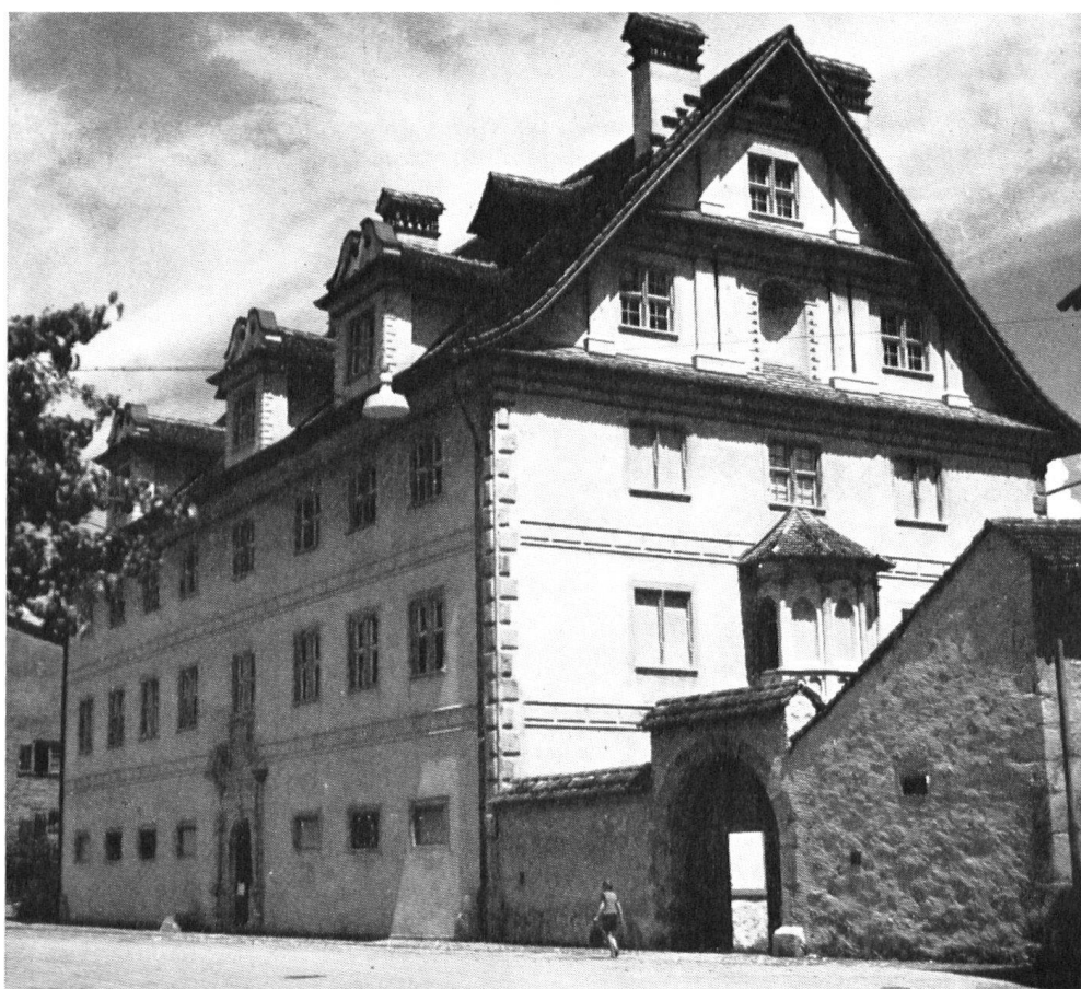
Le palais Freuler à Naefels (1645/47) est le plus important édifice civil du canton de Glaris. Résidence de Caspar Freuler, colonel de la garde royale de Louis XIII. Depuis une excellente restauration, sert de musée cantonal.