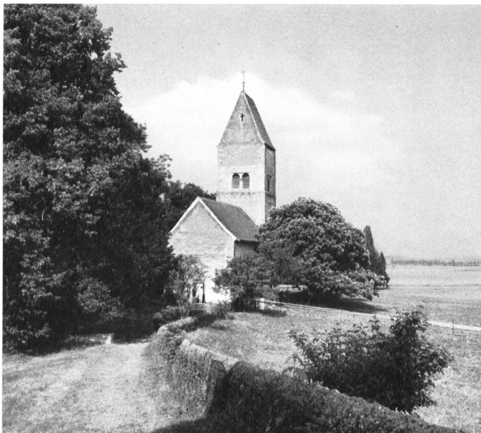
Eglise paroissiale des apôtres Pierre et Paul, dont la construction remonte à 1140, dans l'île d'Ufenau, lieu de paix et de méditation, auquel s'attache le souvenir d'Ulrich von Hutten et du poème poignant de C. F. Meyer. L'île est demeurée en entier propriété du couvent d'Einsiedeln; elle était particulièrement chère à Linus Birchler.