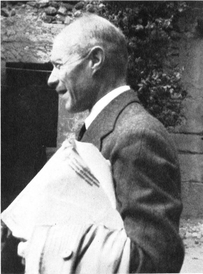
Louis Blondel, 24 novembre 1885 – 17 janvier 1967