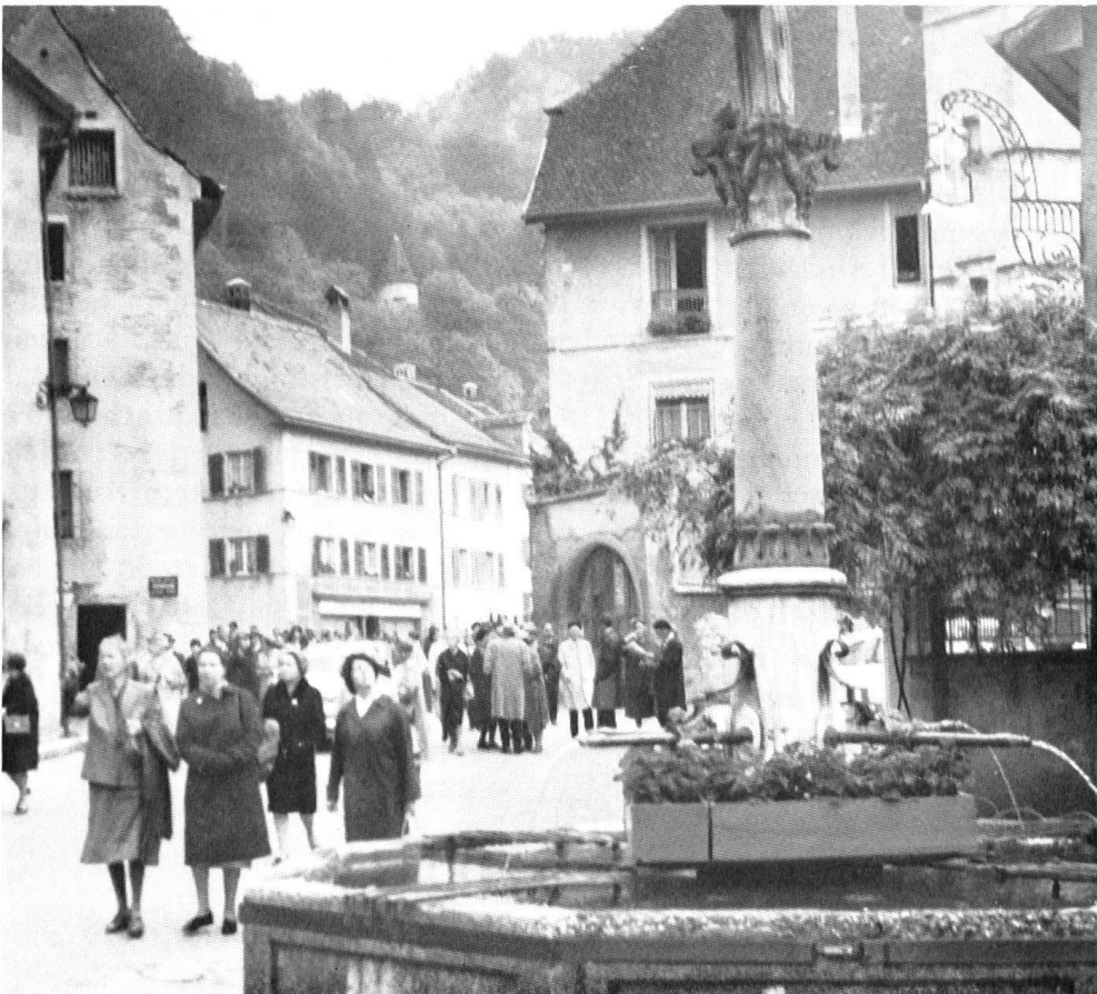
Zwanglos durchstreifte man das Städtchen St-Ursanne, ehe man sich dem wichtigsten Bauwerk, der prachtvollen Stiftskirche, zuwandte.