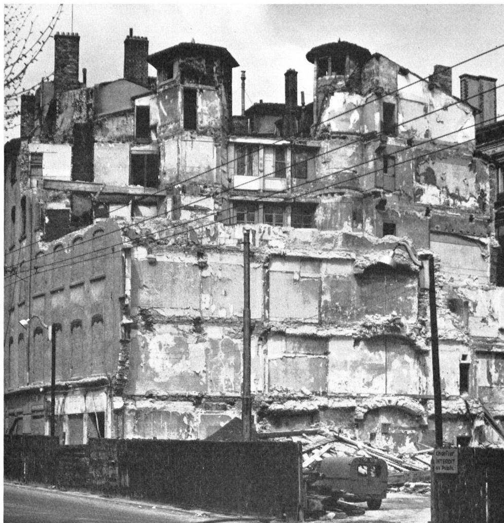
Rue Mercière à Lyon: un îlot Renaissance qui a été démoli en 1966.

Nous sommes bien entendu tous responsables. Les cités, comme les gens, prennent le visage qu'elles méritent. Il s'agit donc de mettre chacun en face de ses responsabilités. On ne peut espérer obtenir à la longue des résultats déterminants par le seul appel à la générosité du public. D'ailleurs, avec le coup de frein à la « surchauffe », le risque est grand que le public et les entreprises restreignent leurs dons.