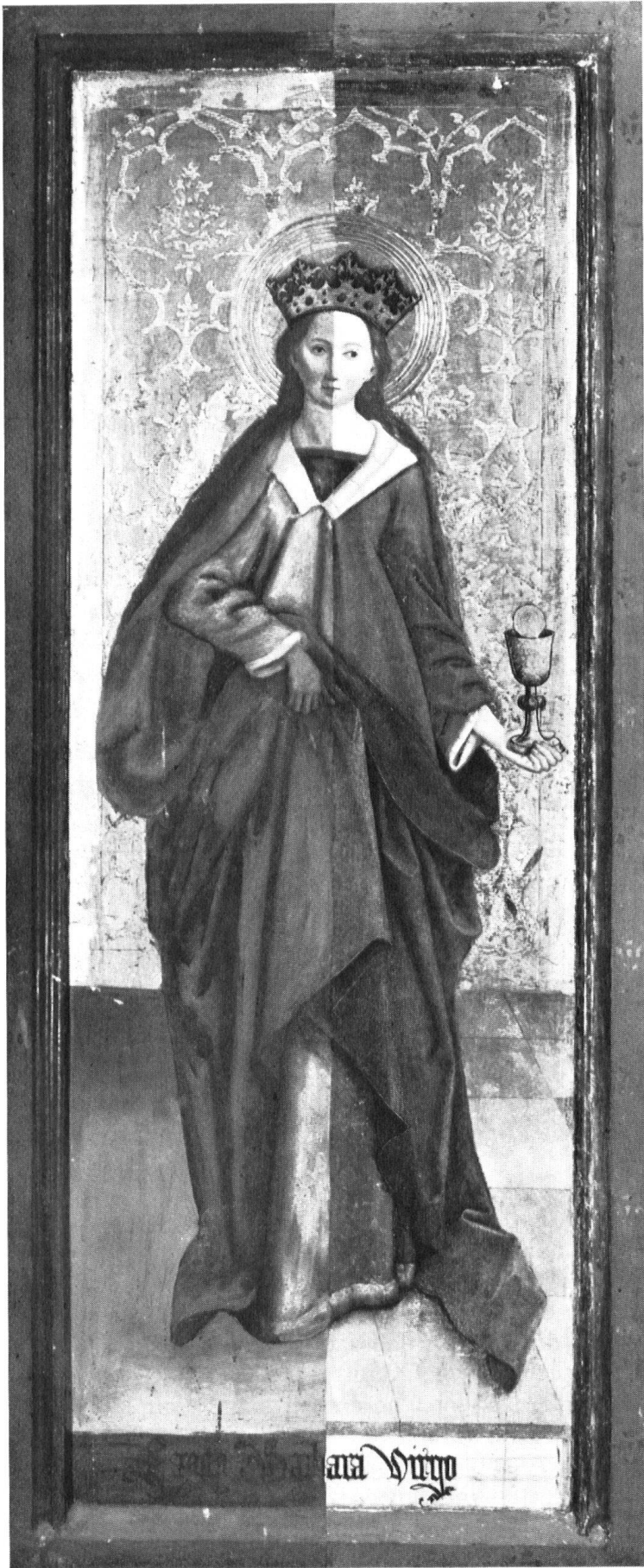
Sur le volet de droite (lui aussi partiellement restauré), sainte Barbara, tenant de la main gauche la coupe du martyr.