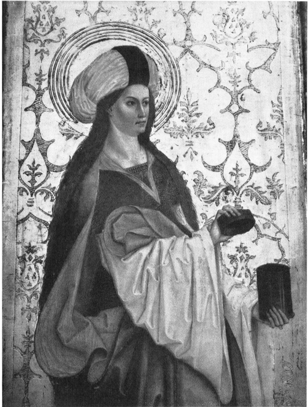
Marie Madeleine (fragment du volet de gauche). Chef-d'œuvre qui, comme les autres peintures, date de 1490 environ.

Marie-Madeleine, à Lumbréin, un autel qui montrera ce dont est capable la technique moderne de restauration artistique.