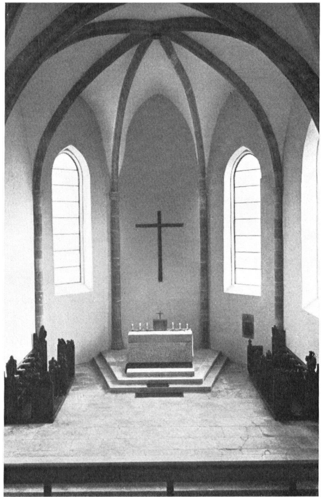
A l'intérieur, la restauration est achevée.

article quelques mécènes qui seraient prêts à apporter aussi leur pierre pour la restauration d'un monument digne du plus haut intérêt? J'ose l'espérer et... vivement.