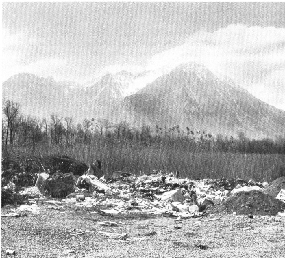
Leider stösst man in der gleichen Gegend, ausser auf Zonen der Kiesgewinnung, auch auf solche reiner Schutt- und Dreckablagerung. Unsere Aufnahme stammt aus der unmittelbaren Nachbarschaft von Villeneuve.