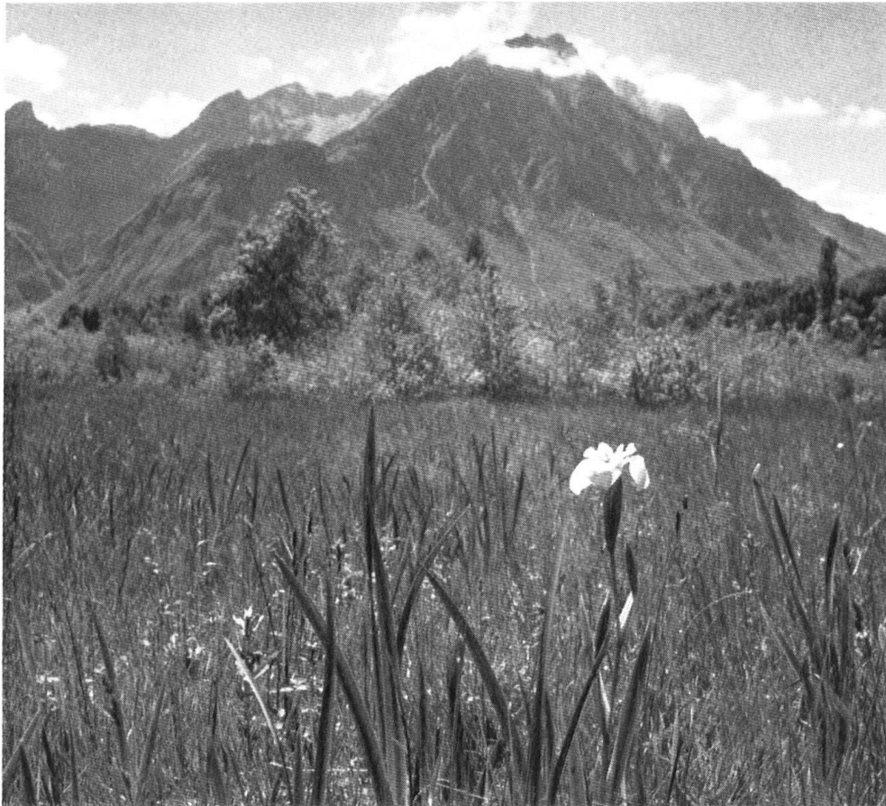
Das Riet in den «Grangettes» nahe der Rhonemündung bildet ein einzigartiges Dorado für den Pflanzen- und Vogelfreund. Es gehört unter allen Umständen geschützt. – Blick gegen den Grammont.