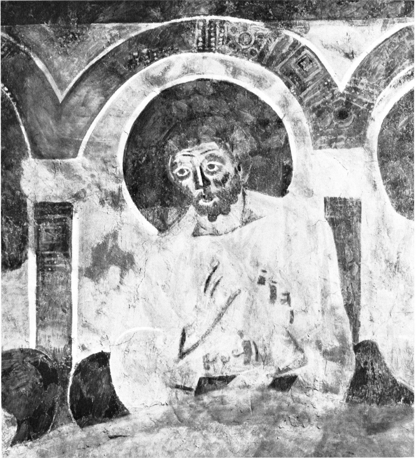
Fragment du Jugement dernier de la paroi ouest, que la tribune des religieuses cache en grande partie aux visiteurs; disciple siégeant à côté du Seigneur. Tableau qui fait particulièrement bien sentir la parenté de style de ces fresques avec l'art monumental de la fin de l'antiquité.

Ci-contre, en haut: La Fuite en Egypte; en bas: Fragment du cycle des fresques romanes de l'abside nord, consacrées à la légende de Pierre et Paul.