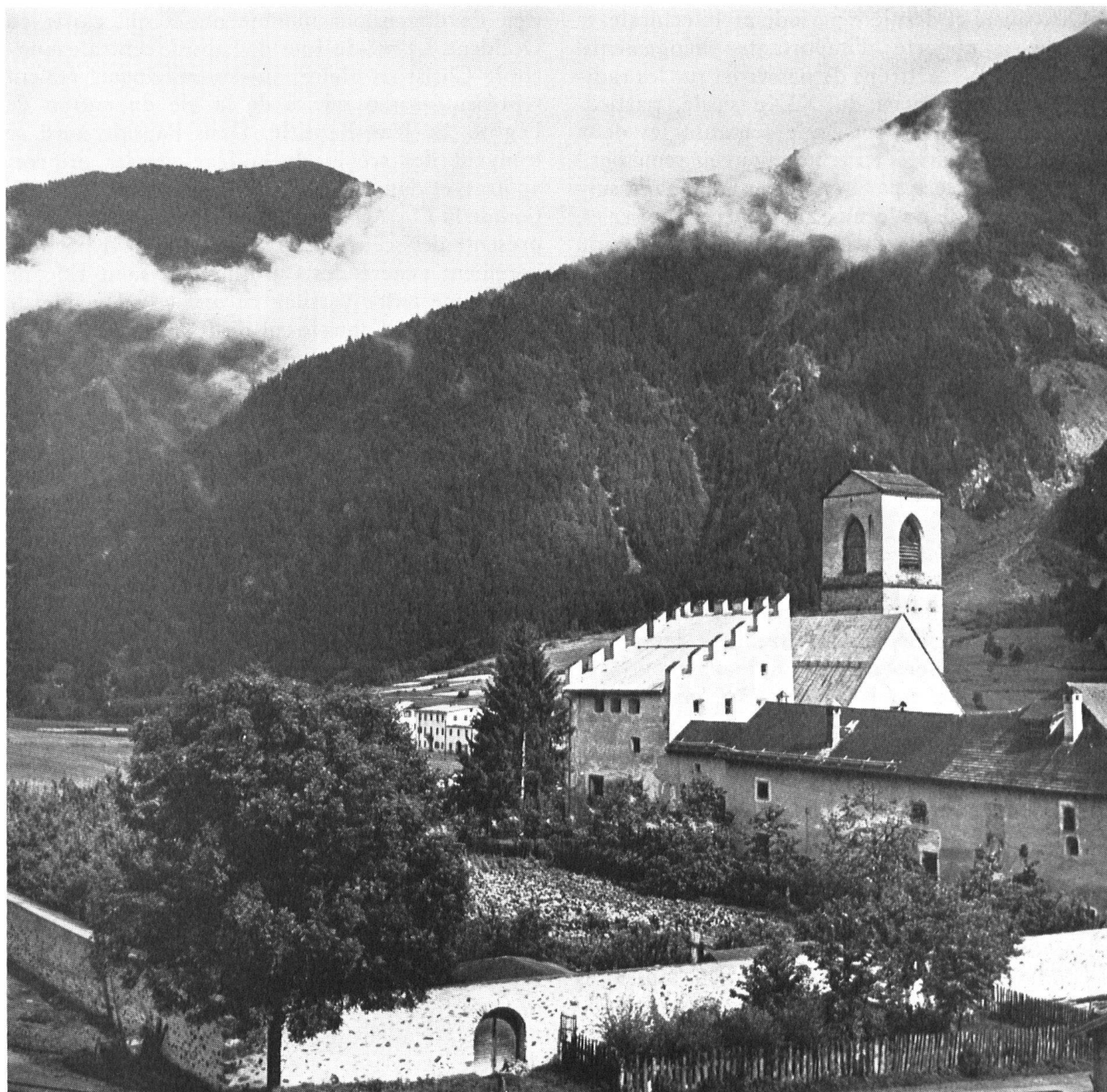
Coup d'œil insolite sur St-Jean; l'aile nord, robuste corps de bâtiment de la fin du moyen âge, et la tour Planta au toit à un seul pan bordé de créneaux.

Il s'agit de parties qui datent de la reconstruction du couvent au XI e siècle; des transformations et nouvelles constructions furent rendues nécessaires par l'incendie signalé en 1079. Elles se situent à l'époque de l'évêque Norpert, qui dans la querelle des Investitures s'était rangé aux côtés d'Henri IV et pour ce motif ne fut pas reconnu à Coire, ce qui l'obligea à se réfugier dans le val Münster. Il doit avoir résidé à Müstair, et de fait, lorsqu'on exa-