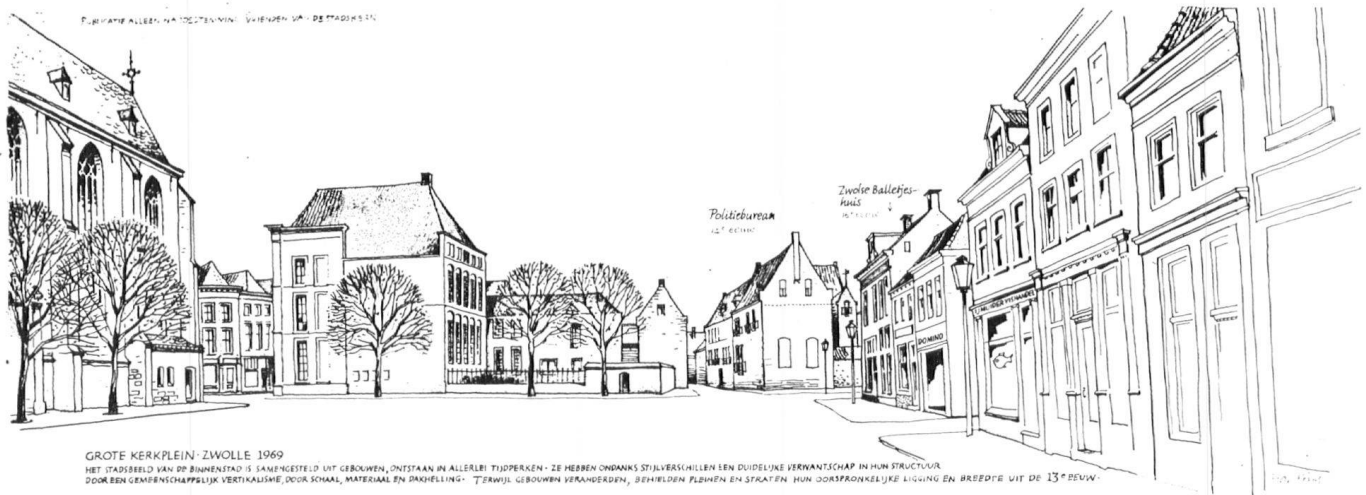
GROTE KERKPLEIN - ZWOLLE 1969

HET STADSBEELD VAN DE BINNENSTAD IS SAAMEGESTELD UIT GEBOUWEN, ONTSTAAN IN ALLEERLE TIJDPERKEN - ZE HEBBEN ONDANKS STIJLVERSCHILLEN EEN DUIDELIJKE VERWANTSCHAP IN HUN STRUCTUUR. DOOR EEN GEMEENSCHAPPELIJK VERTIKALISME, DOOR SMAAL, MATERIAAL EN DAKHELLING - TERWIJL GEBOUWEN VERANDEREN, BEHULDEN PLAZEN EN STRATEN HUN DOORSNODENLIJKE LICHTING EN BREEDTE UIT DE 13 e EEUW.