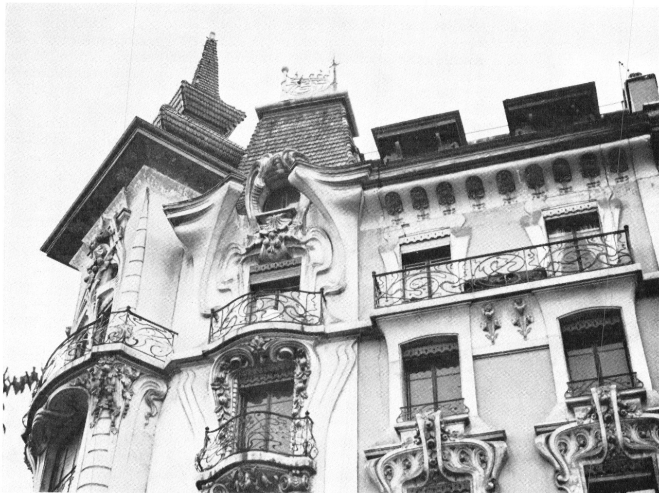
Das «Pfauenhaus» in Genf-Eaux-Vives, eines der wenigen unverfälschten Beispiele der Jugendstilarchitektur unseres Landes. Die Gestaltung der oberen Fassadenpartien; man beachte die reiche Dekoration der Balkonfenster-Einfassung halblinks.