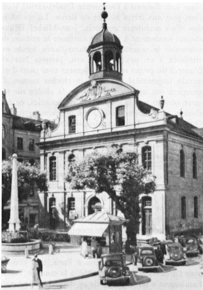
A Genève, le plus frappant exemple de l'architecture réformée française, est le Temple Neuf, appelé aujourd'hui église de la Fusterie, dont l'architecte est Jean Vennes (1715).

Neuchâtel – La première église protestante construite en Suisse romande sur le modèle des églises classiques réformées de France est le Temple du Bas à Neuchâtel (1695) sur les plans de J. Humbert-Droz.