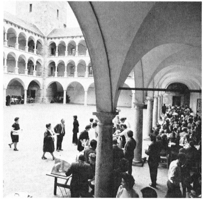
Mit einer Raclette klingt das Jahresbott 1971 des Schweizer Heimatschutzes im weiten Arkadenhof des Stockalperschlosses zu Brig stimmungsfroh aus.

werden können; deren bevorstehende Ausarbeitung wurde denn einhellig begrüsst.