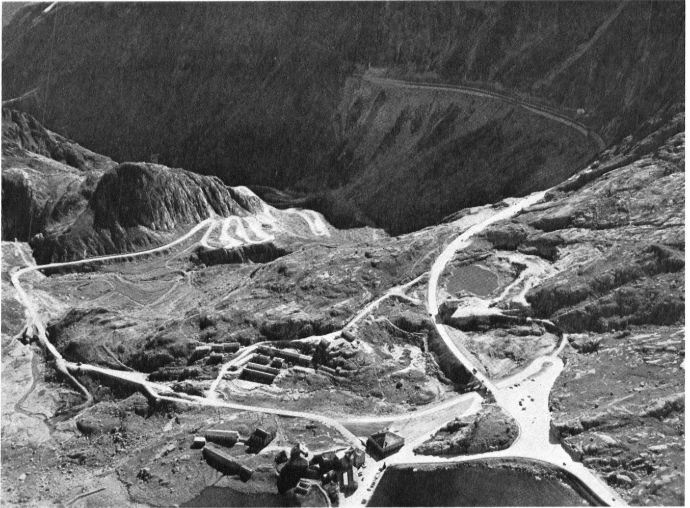
Vue aérienne, à comparer avec celle de la page 13. À gauche, l'ancienne route avec les lacets de la gorge de Tremola; à droite, la nouvelle route.