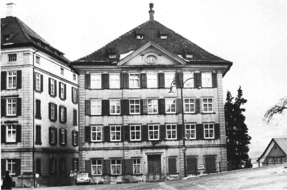
Trogen. Pfarr- und Gemeindehaus. Nordfassade

Die Restaurierung dieses bedeutenden Gebäudes als «Réalisation exemplaire» des Kantons wird dessen kunstgeschichtlich-kulturpolitischen Stellenwert gebührend ins öffentliche Bewusstsein heben.