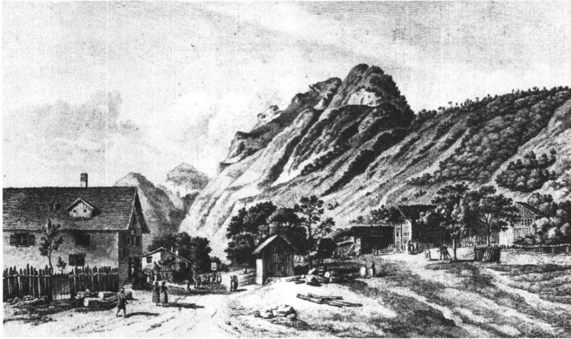
Näfels. Fahrtsplatz. Stich von H. L. Schmutz, 1779. Hinten das «Rössli», in der Mitte des Platzes das zu restaurierende Haus in seiner ursprünglichen Form