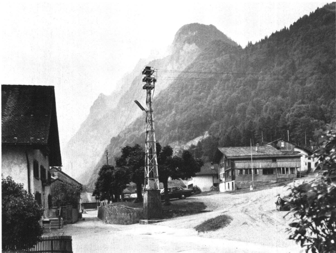
Näfels. Fahrtsplatz. Heutiger Zustand, der nach der alten Vorlage saniert werden soll; der hässliche Elektromast soll verschwinden