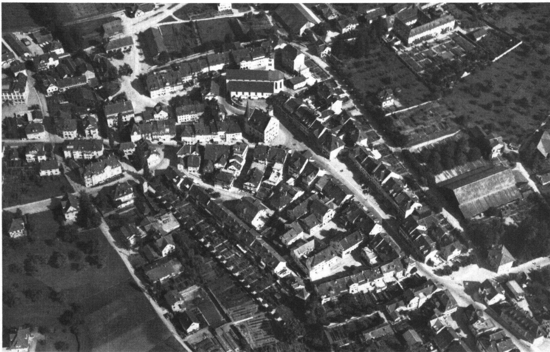
Sursee. Flugaufnahme der Stadt von 1946

Der geistigen Blüte des Stiftes um 1600 entsprach auch die künstlerische. Sehr hohe handwerkliche Qualität der einzelnen Bauteile anfangs 17. Jahrhundert: die Treppenanlage im Chor, das Chorgestühl, das Stiftergrabmal, die Gitter der Seitenschiffe sind Zeugnisse dafür. Nachdem die St.-Gallus-Kapelle eine frühbarocke Ausstattung erhalten hatte, wurde 1680 Kaplan Jeremias Schmid als Architekt mit der Barockisierung der ganzen Kirche beauftragt. Eine zweite Barockisierung (1773–1775) verwischte, was die Stukkierung und Ausstattung betrifft, die erste fast restlos. Sie gab der Stiftskirche