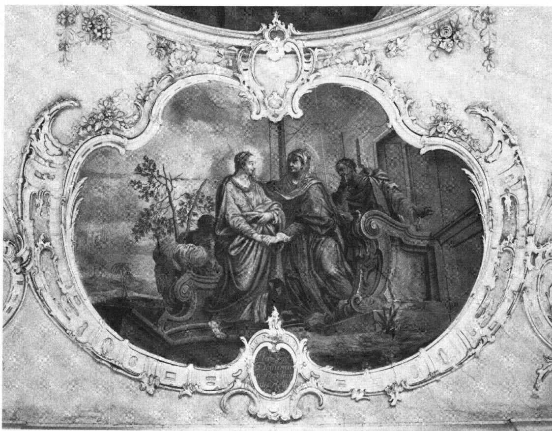
Seewen SZ. Marienkirche. Rokoko-Stukkaturen von Scharpf und Klotz (1772/1774) und Fresko von Josef Ignaz Weiss

Das Innere der Marienkirche in Seewen gehört zu den besten Zeugnissen barocker Raumkunst der Gegend von Schwyz . Die 1772–1774 entstandenen Stukkaturen sind gleichzeitig mit denjenigen in der Pfarrkirche Schwyz entstanden. Der kleine intime Raum der Marienkirche stellt in seinem Stuckdekor das unbeschwert Grazile des Rokokos weit mehr in den Vordergrund, als dies in der Pfarrkirche Schwyz möglich war. Mit bemerkenswerter Sicherheit und ausgewogenem Gefühl für Rhythmus umranken zarte, mit lieblichen Blumengirlanden durchsetzte Rocailen- und Palmettenmotive