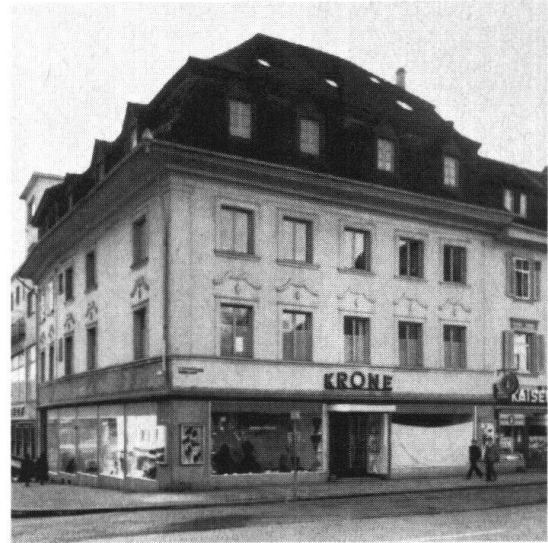
Olten. Hotel zur Krone. Zustand um 1840 (links) und heute (Vorschlag der Wiederbelebung einer historischen Herberge und Gastwirtschaft)

kaufte es seinerzeit auf Abbruch, um den – rein lokalen – Verkehr flüssiger gestalten zu können. Damit aber würde einem organisch gewachsenen Dorfbild das Rückgrat gebrochen. Die zuständigen Verkehrsleute vertreten übrigens die Ansicht, Tempobeschränkung bzw. Stoppsignal würden durchaus genügen.