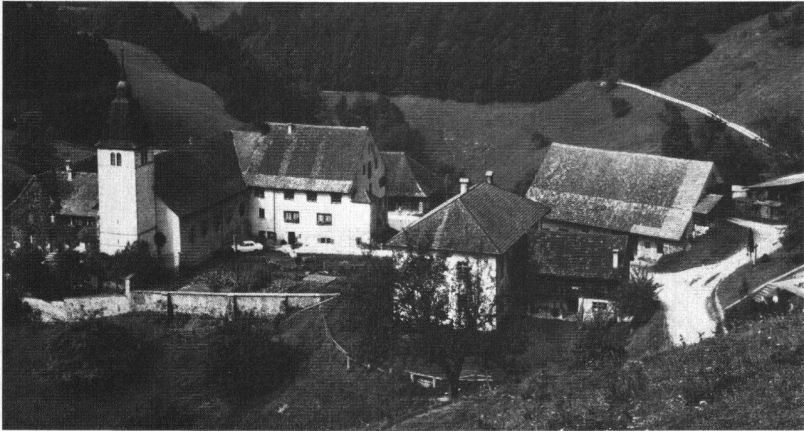
Beinwil SO. Ehemaliges Benediktinerkloster von Osten

Kirchen- und die Einwohnergemeinde Beinwil und der Staat Solothurn vertreten sein. Ziel ist es, hier wieder ein geistiges Zentrum zu schaffen, wie es vor 700 Jahren bestand, eine Renaissance von Beinwil im ökumenischen Geist.