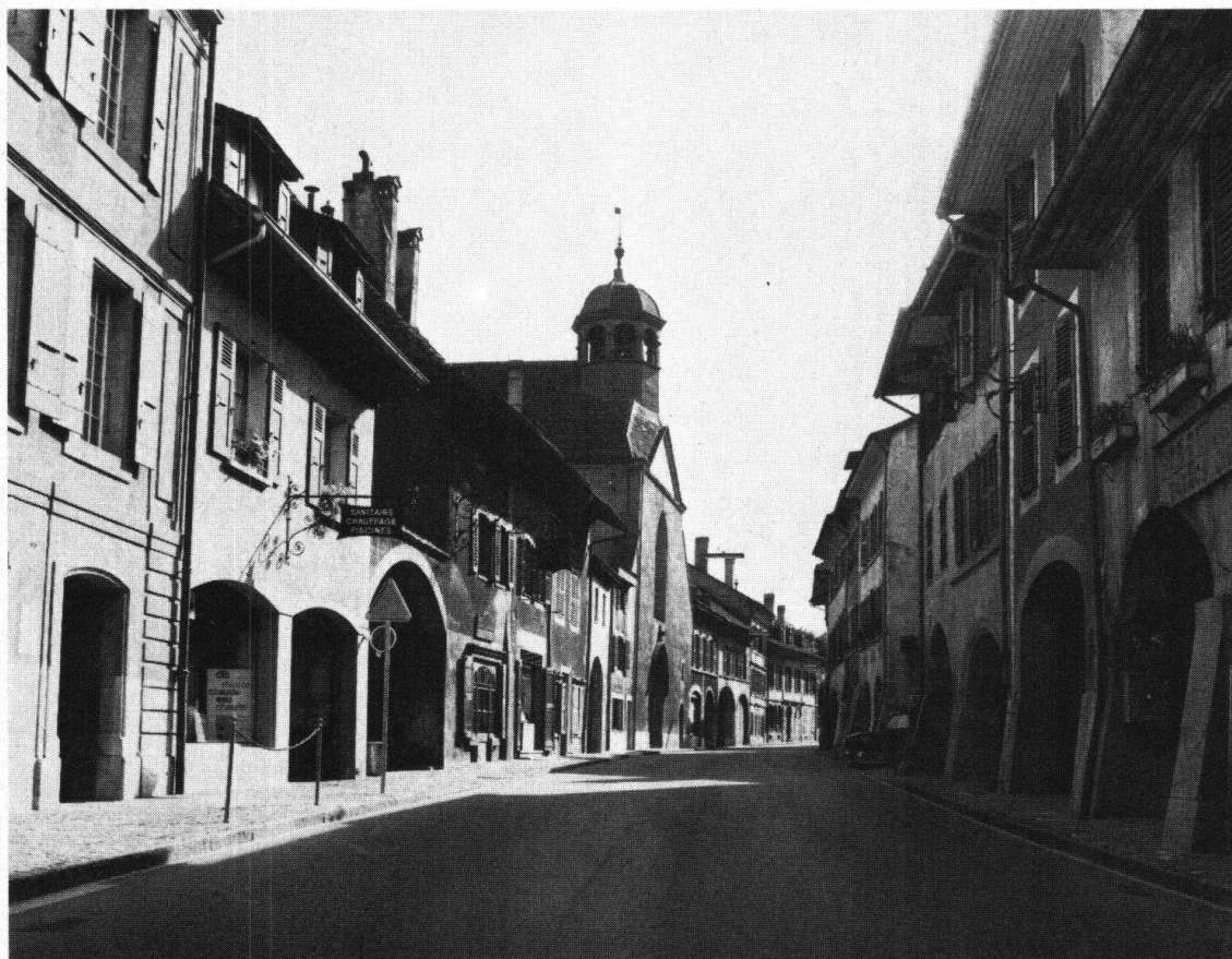
Coppet. Rue principale de la ville – menacée par le trafic routier

n'y veillent pas, leur commune risque de devenir une «cité-dortoir» de Genève. On sait à quel point l'équilibre entre l'habitat et toutes les autres activités est important.