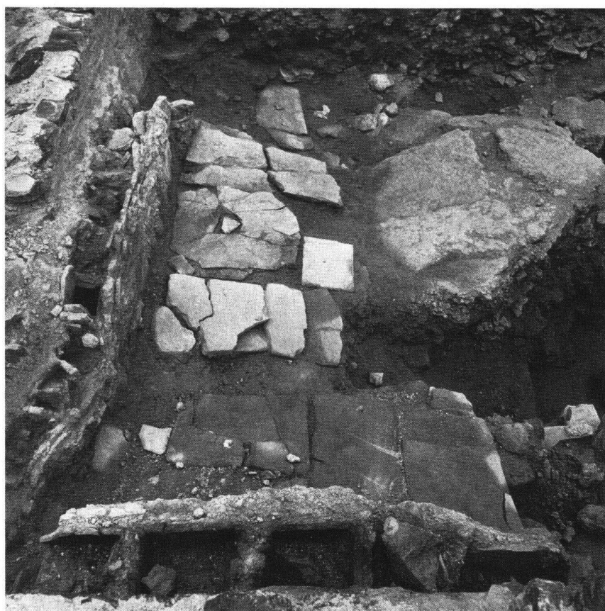
Martigny. Ville romaine Octodurus. Fouilles

Le programme relatif à Octodurus vise à éviter le massacre des vestiges antiques lors de constructions modernes, à mettre en valeur (sur place ou en musée) les plus belles trouvailles, à restaurer le « Vivier » (ruines de l'amphithéâtre), à recueillir le maximum de renseignements scientifiques et à intéresser le grand public. Ces buts doivent être atteints sans paralyser le développement de Martigny. Les rapports entre les besoins de la vie moderne et la sauvegarde des témoins d'un passé remarquable doivent être résolus ici de manière exemplaire.