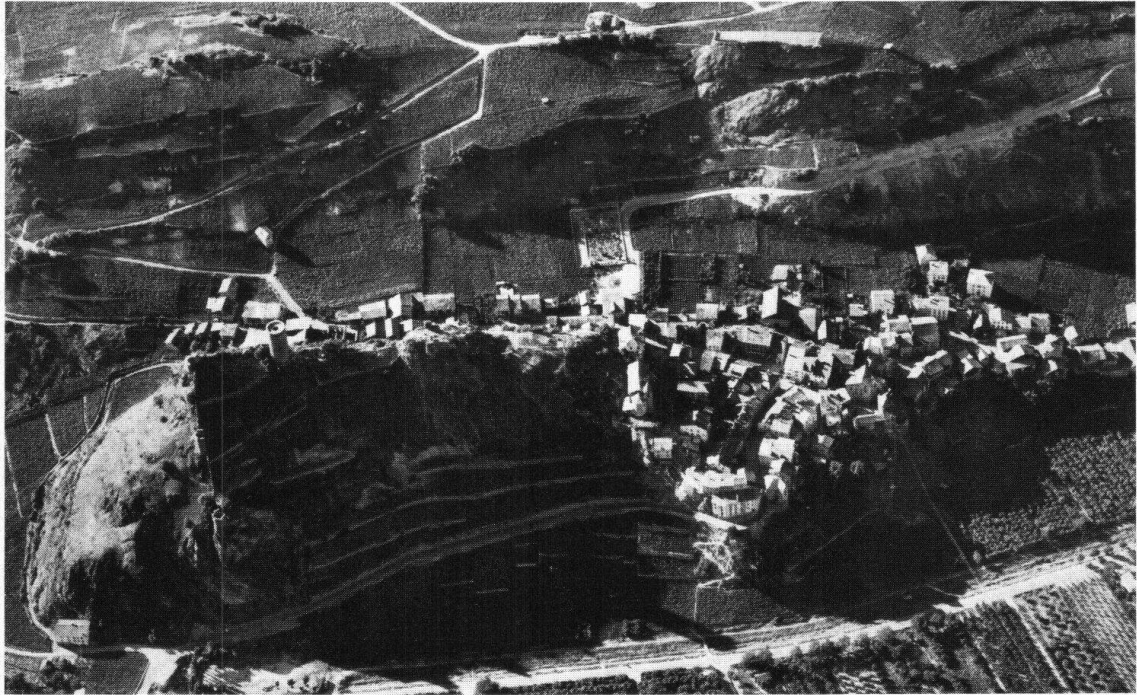
Saillon. Vue aérienne du bourg