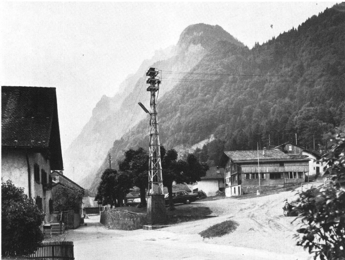
Näfels. Fahrtsplatz. Heutiger Zustand, der nach der alten Vorlage saniert werden soll; der hässliche Elektromast soll verschwinden