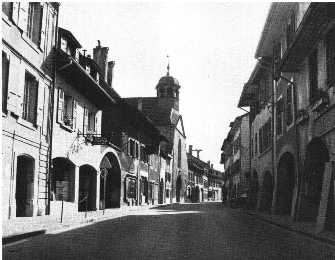
Coppet. Rue principale de la ville – menacée par le trafic routier

n'y veillent pas, leur commune risque de devenir une «cité-dortoir» de Genève. On sait à quel point l'équilibre entre l'habitat et toutes les autres activités est important.