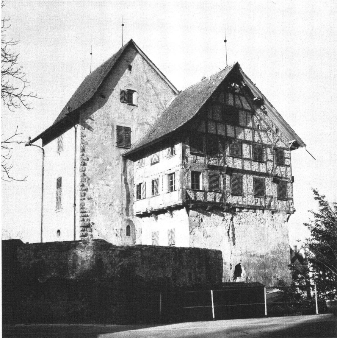
Zug. Die zu restaurierende Burg, die zum Museum ausgebaut wird