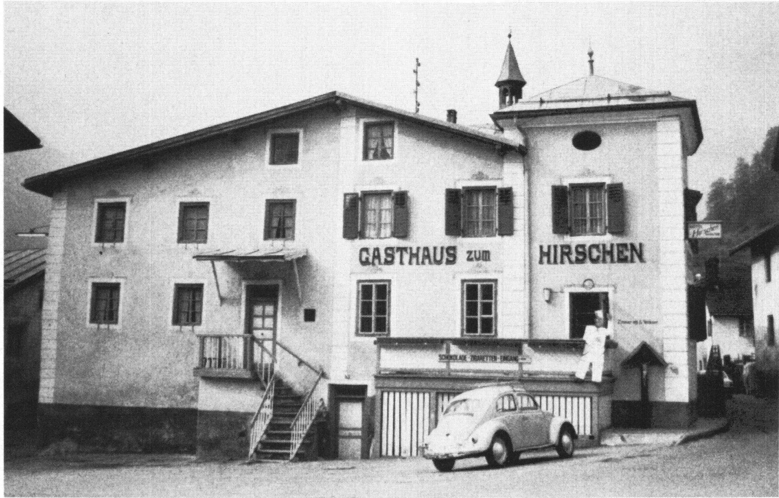
MÜSTAIR GR. Hotel Hirschen vor und nach der Restaurierung. Das den Platz Grund massgeblich prägende Gebäude ist im ersten Drittel unseres Jahrhunderts umgebaut und mit einem turmartigen Aufbau versehen worden. Bei der Fassadenrestaurierung von 1974 entdeckte man eine originale Sgraffitodekoration von 1613, welche wiederhergestellt wurde und die Rekonstruktion der ursprünglichen Fensterdisposition gestattete. Auf die ursprüngliche Dachneigung, die von der Dekoration markiert wird, konnte man aus Nutzungsgründen nicht zurückgehen.