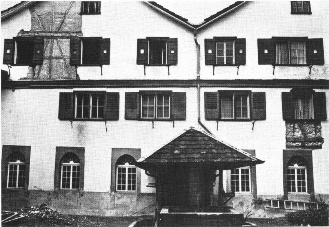
MAGDENAU SG. Zisterzienserinnen-Kloster. Die den Innenhof (Kreuzgang) umstehenden Gebäude sind gossenteils Riegelbauten. Unsere Bilder zeigen die Südseite des Innenhofes vor der Restaurierung mit dem verputzten Riegelwerk und die Nordseite nach der Restaurierung mit dem freigelegten und instandgesetzten Riegelwerk.