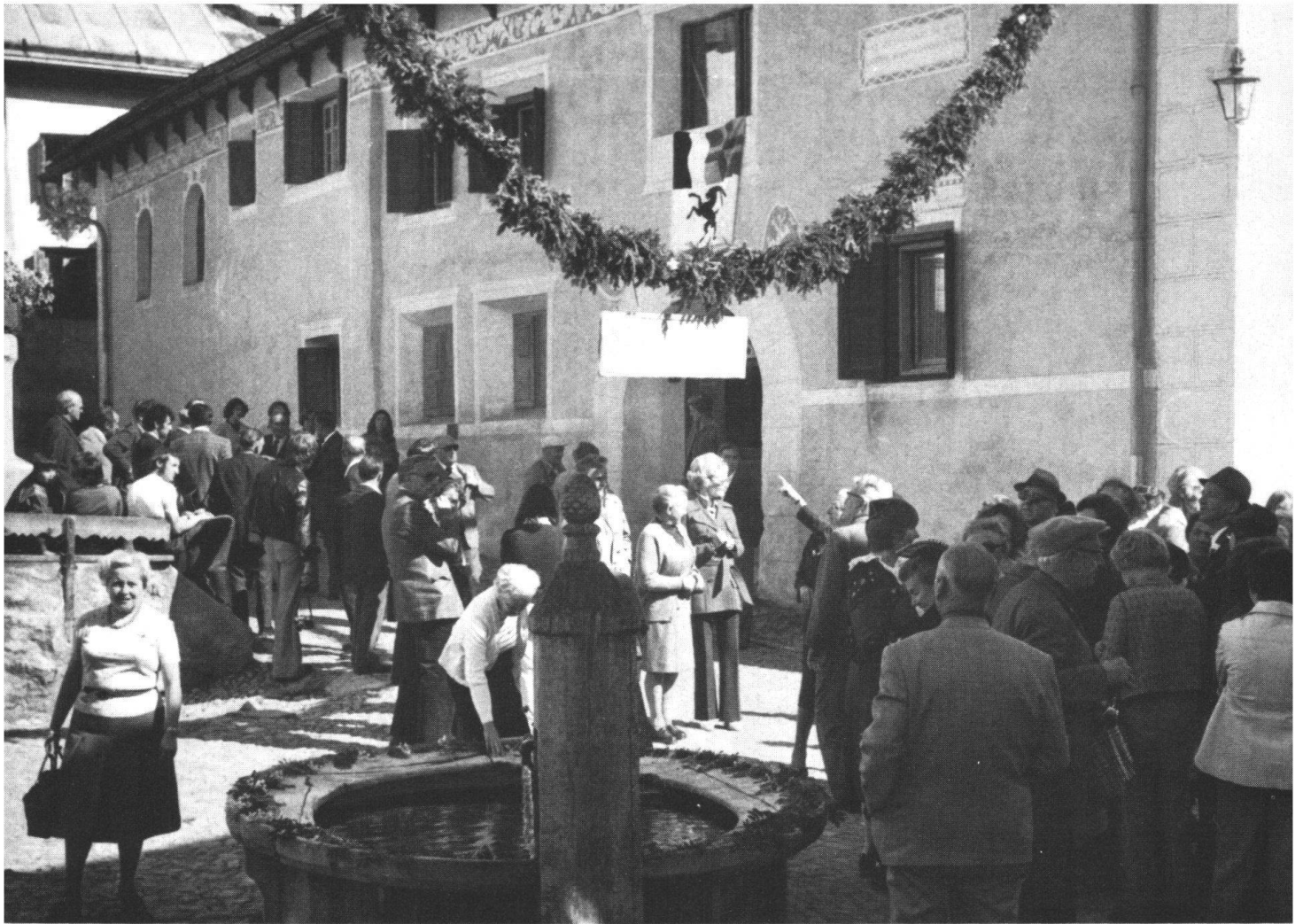
In grössern und kleinern Gruppen lassen sich die Besucher vor der Feier durch das Dorf führen.

die Sorge um die Siedlung in den Jahren seither nicht abgebrochen. Noch vor kurzem hat man beispielsweise die Hauptgasse gepflästert und die vielen Fernseh-«Dachzierden» durch eine Gemeinschaftsantenne ersetzt, was um so höhere Anerkennung verdient, als die Kosten, auch bei Unterstützung von aussen, der kleinen Berggemeinde und ihren Bewohnern ins Mark griffen.