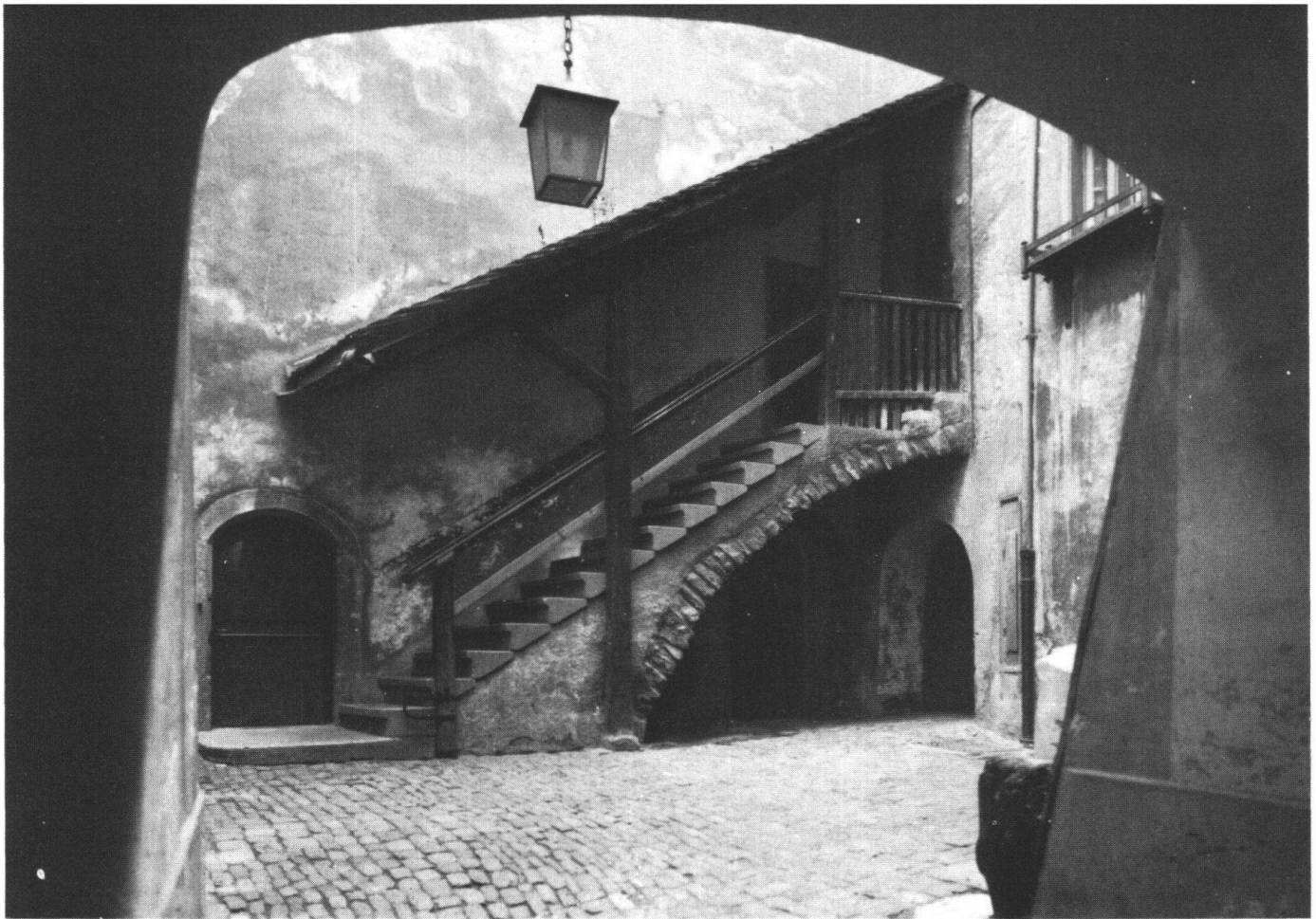
Der erste Preis für Gruppenarbeiten ging an «Baerenloch», von W. Böniger, Balzers, und M. van Grondel, Chur.

Dies Schauen zu lehren ist aber nicht zuletzt die Aufgabe des Fotografen.