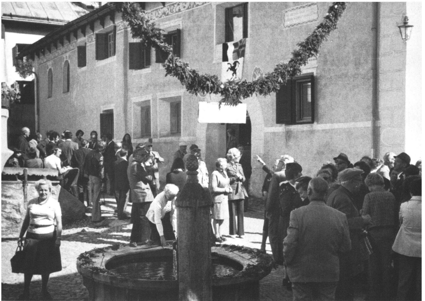
Visite du village avant la cérémonie.

exemple, on a repavé la rue principale, et les nombreuses antennes de télévision qui «ornaient» les toits ont été remplacées par une antenne commune avec réseau souterrain, ce qui mérite d'autant plus de reconnaissance que les frais, pour cette modeste commune montagnarde de 140 habitants, et même en tenant compte des appuis extérieurs, ont été lourds.