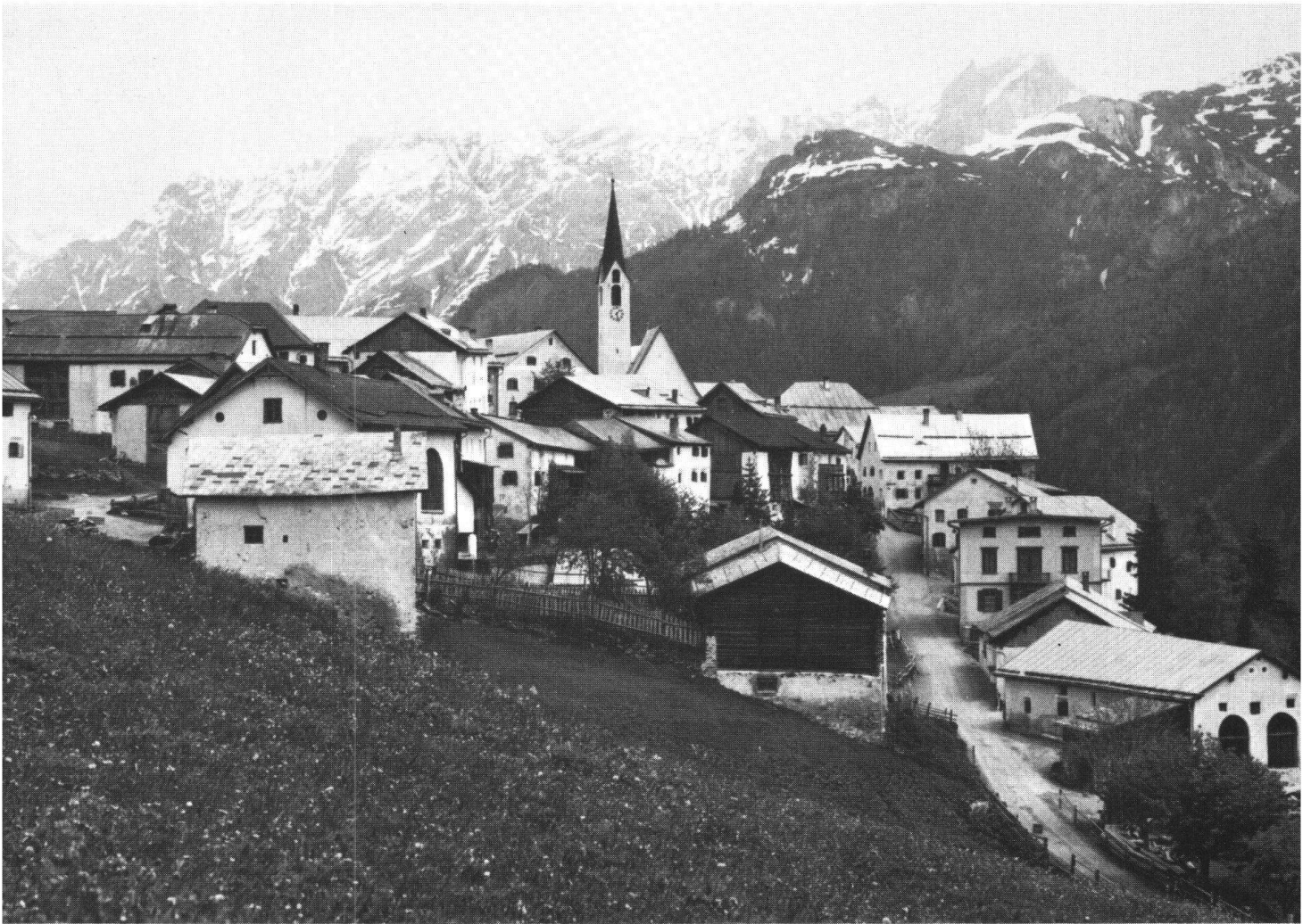
Le village de Guarda, en Basse-Engadine.

Guarda et la disposition et fonction de ses maisons en 1971. Tiré de Jürg Rohner: «Studien zum Wandel der Bevölkerung und Landwirtschaft im Unterengadin» (Basler Beiträge zur Geographie, 1972).