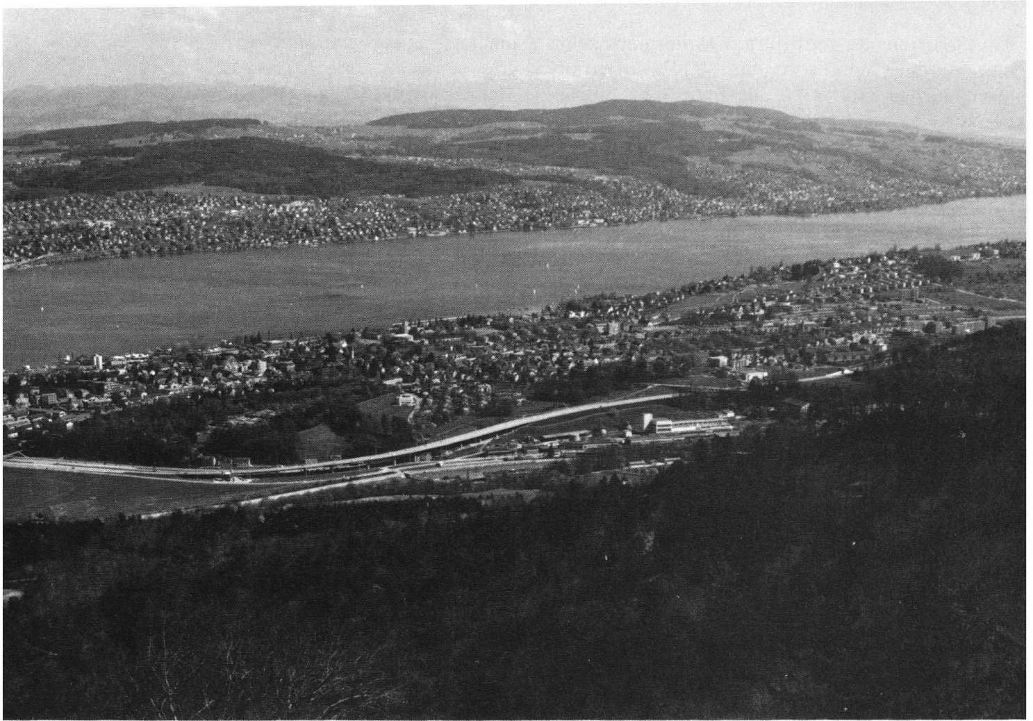
Le bas-lac de Zurich dans les années 1920 (à gauche) et 1970 (à droite). En l'espace d'un demi-siècle, les villages riverains se sont transformés en larges rubans urbains et quartiers de villas.

distinction entre zones à bâtir et zones interdites à la construction. La protection vise la construction exagérée de logements, d'ateliers et de bâtiments industriels, aussi bien que d'édifices publics. Elle n'implique aucune interdiction de construire, mais simplement les limitations qu'exige l'affectation, de cas en cas, des zones protégées.