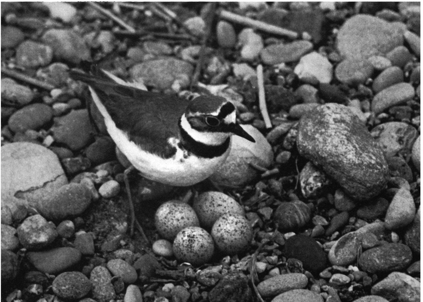
Flussregenpfeifer mit Gelege

Uns Binnenländer berührt besonders auch der Durchzug der Strandvögel. Regenpfeifer in fünf Arten, Steinwälder, Bekassine, Zwergschnepfe, Waldschnepfe, Brachvogel, Regenbrachvogel, Uferschnepfe, Pfuhlschnepfe, Waldwasserläufer, Bruchwasserläufer, Rotschenkel, Dunkler Wasserläufer, Grünschenkel, Flussuferläufer, Kampfläufer, Knutt, Zwergstrandläufer, Temminckstrandläufer, Alpenstrandläufer, Sanderling, Säbelschnäbler, Stelzenläufer, Odinhühnchen, Triel führt die lange Liste der Bolle auf, die jedem Ornithologen das Herz höher schlagen lässt. Dazu kommen 6 Taucherarten, Kormoran, 8 Reiherarten, 18 Entenarten, 10 Möwen- und Seeschwalbenarten. Auch ein Aussenstehender begreift, welche Bedeutung diesem Gebiet für die Vogelwelt zukommt und weshalb gerade dem Vogelfreund der Schutz des Gebietes ganz besonders am Herzen liegt.