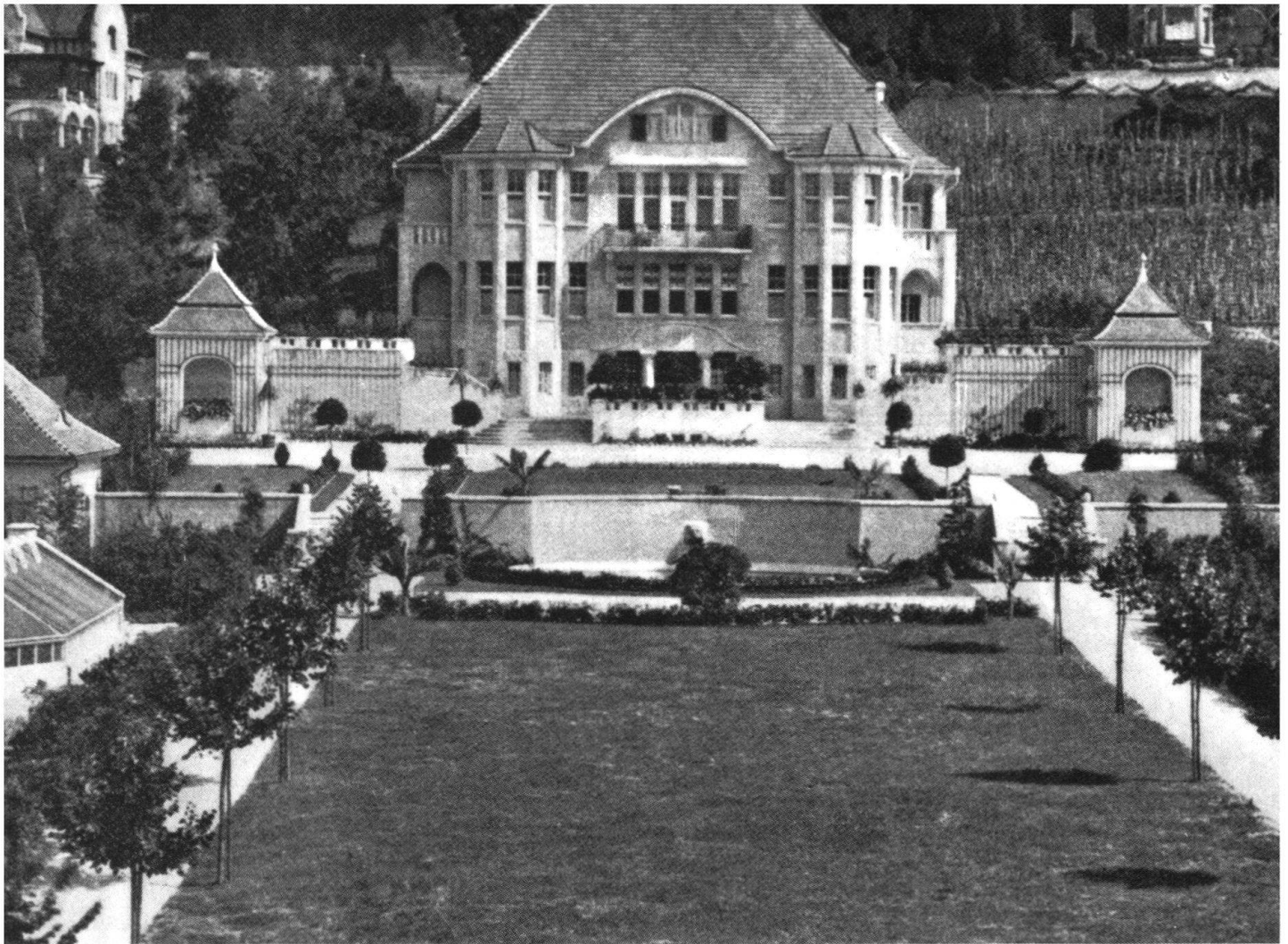
Oben: Ehemalige Villa Müller-Renner mit Architekturgarten, 1907 von Rittmeyer und Furrer angelegt, 1961 für den Bau des Personalhauses des Kantonsspitals abgebrochen. Die Villa rechts im Hintergrund ist ebenfalls abgebrochen worden, jene links hinten durch ein Abbruchge-

such gefährdet. Damit erlischt eine kulturgeschichtlich bedeutsame Periode der Stadtentwicklung. – Unten: Der letzte Abschnitt der Ausstellung zeigte die Gestaltungselemente – hier Gartenlauben und Pergolen.