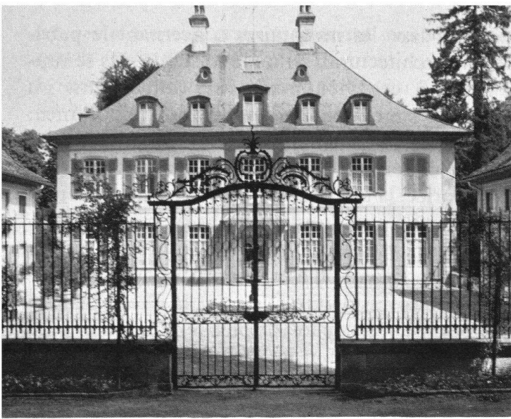
Le magnifique parc de la maison de campagne «Ebenrain», édifié vers 1770 près de Sissach BL, fut aménagé sur le modèle français, mais transformé plus tard dans le goût romantique.

née européenne du patrimoine architectural: du monument prestigieux et isolé, qui comme tel est de moins en moins menacé aujourd'hui, on a mis toujours davantage l'accent sur les ensembles architecturaux. Transposé dans le domaine des jardins, cela signifie que ceux des châteaux et manoirs ne doivent pas rester seuls au premier plan, mais qu'on doit aussi prendre en considération ceux des maisons bourgeoises, des villas, des fermes, soit parce qu'ils présentent certaines particularités ou quelque valeur historique, soit parce qu'ils constituent, de par leur fonction, un élément important d'une localité ou d'un paysage.