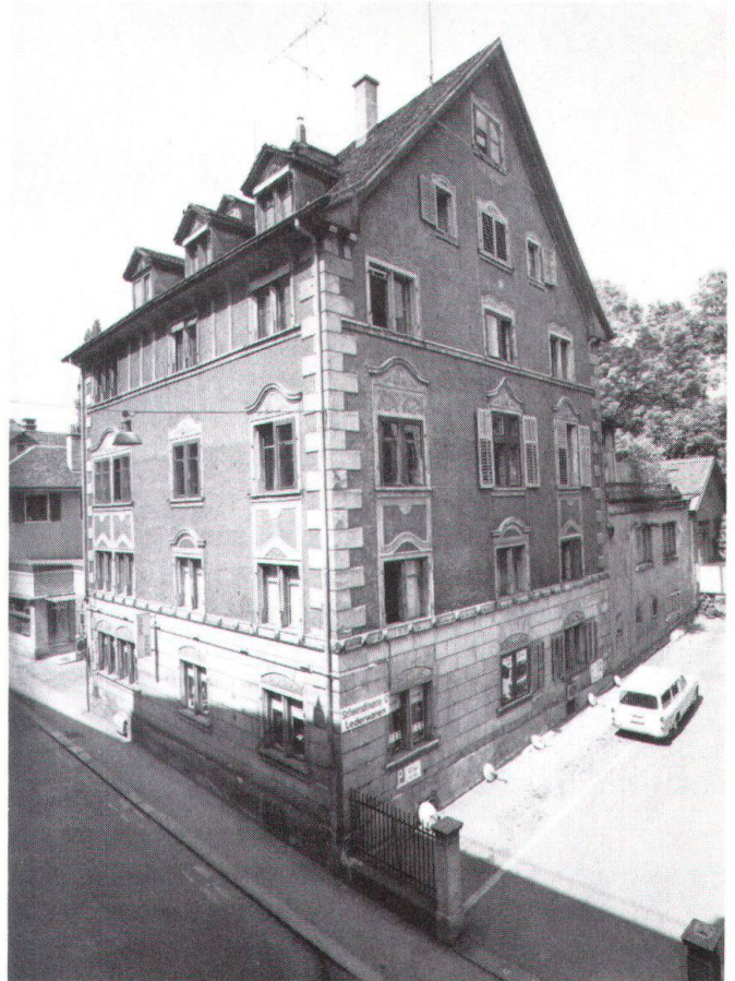
Photo ci-contre: cette image date de 1947, mais l'enfilade des maisons n'a guère été modifiée jusqu'à nos jours.

En bas: intérieur d'un logis ancien de l'Augustinergasse. En haut: une des maisons médiévales qui, par leur acquisition en 1976, ont pu être sauvées de la démolition.