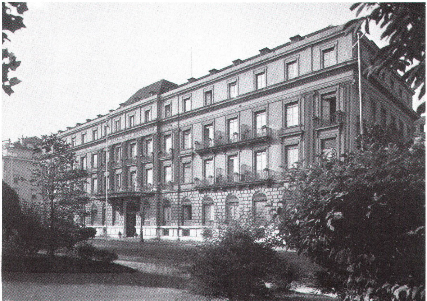
Photo à la page 13: Situé sur le Quai du Général-Guisan, l'hôtel Métropole fait partie d'un ensemble architectural d'intérêt national: la rade de Genève.

Construit en molasse verte, l'hôtel est de style néo-classique tardif. Il témoigne de la grande expansion des constructions hôtelières genevoises par son allure de palace.