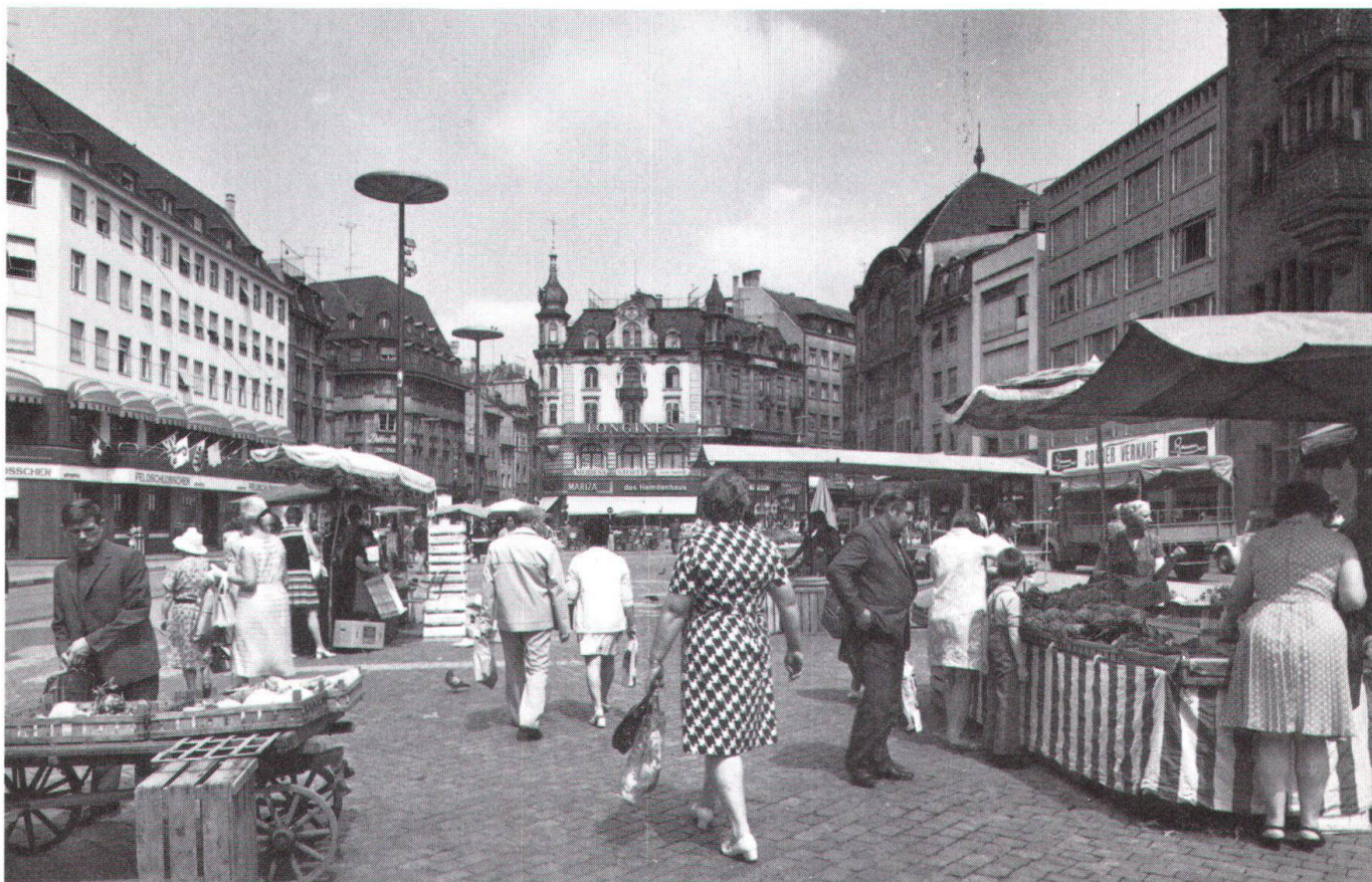
En haut: la place du Marché actuelle. En bas: le premier projet du «Markthof» de 1973, renvoyé à une commission par le Législatif communal de Bâle, rompait toute harmonie dans les proportions.