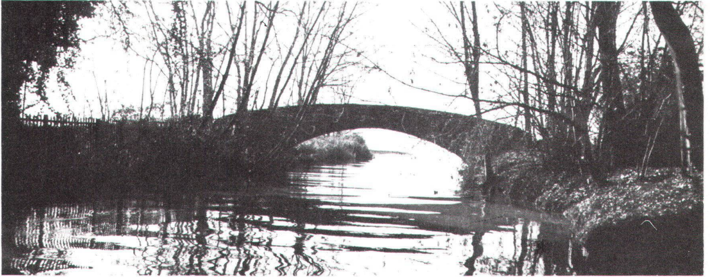
Le projet de place de sport aurait aussi fait disparaître des coins charmants.

schutz) ont immédiatement lancé contre la décision du Grand Conseil un référendum financier cantonal , qui a recueilli plus de 43 000 signatures en trois semaines. Les arguments des opposants étaient: