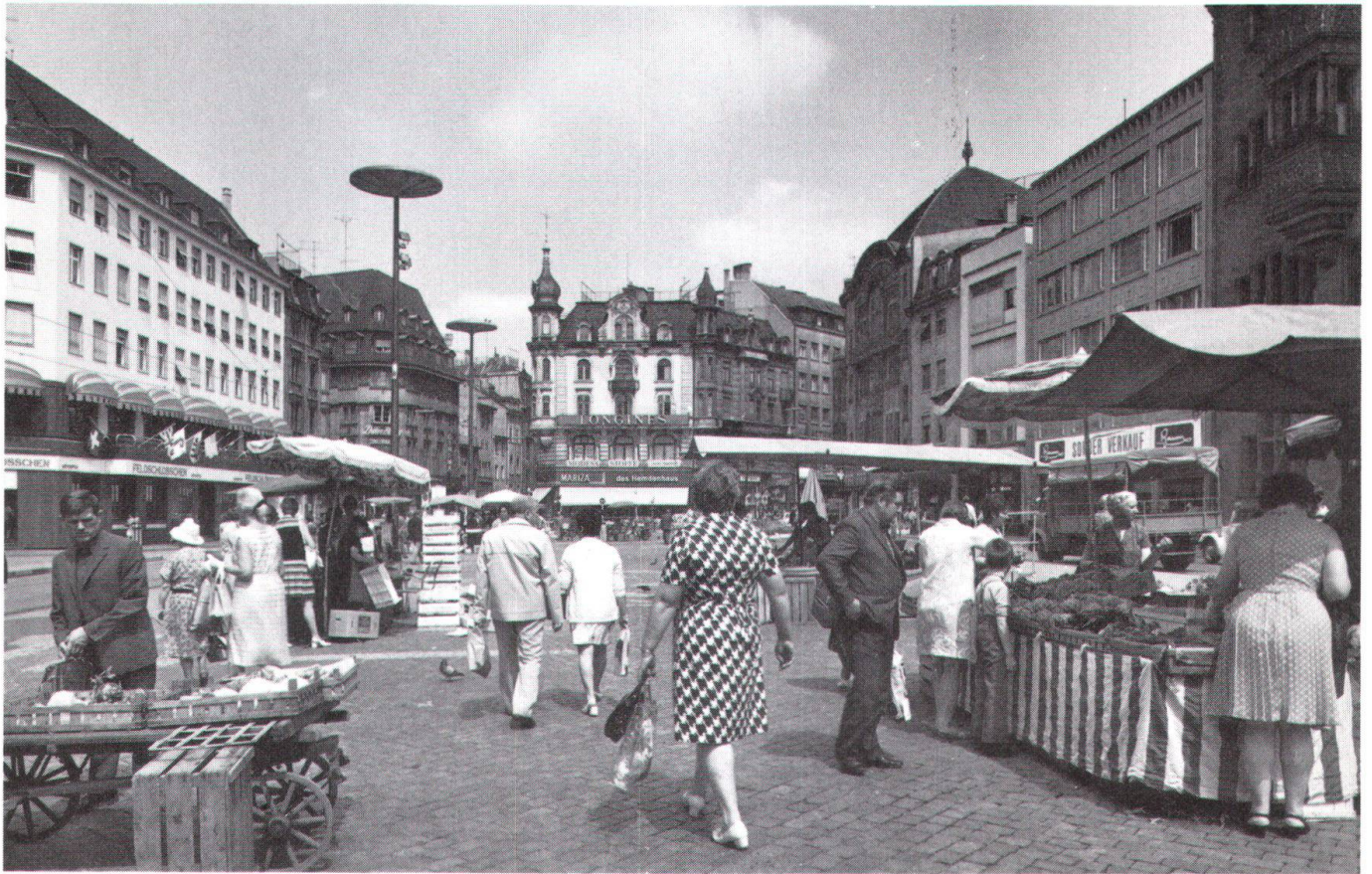
En haut: la place du Marché actuelle. En bas: le premier projet du «Markthof» de 1973, renvoyé à une commission par le Législatif communal de Bâle, rompait toute harmonie dans les proportions.