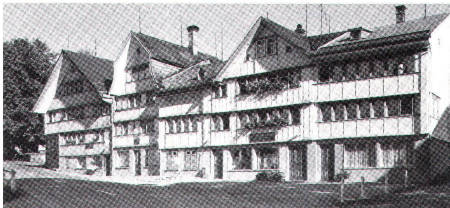
Gais hat an Architektur eben mehr als seinen legendären Dorfplatz zu bieten.