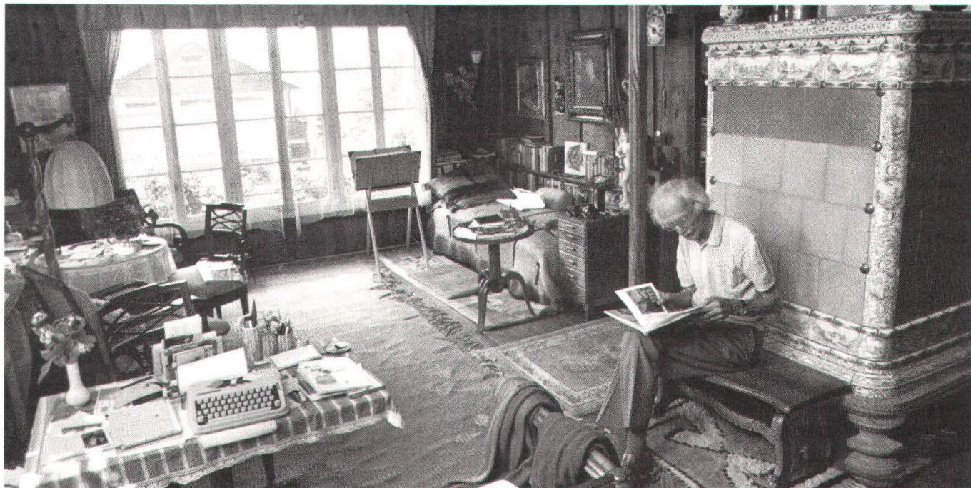
Der aus dem «Talerdienst» scheidende Künstler in dessen Heim in Herrliberg.