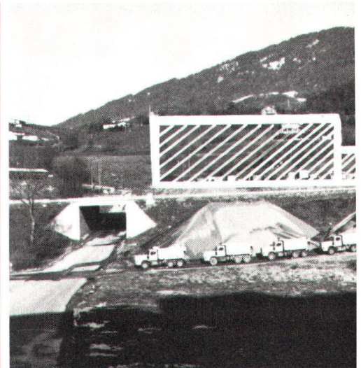
Premier projet de hangars, au nord de l'autoroute N9 (20 m et 10 m de hauteur, environ 150 000 m 3 ), mis à l'enquête. Le second projet est plus réduit, mais n'a pas été rendu public.

Les quelques cas, parmi d'autres, que nous allons citer, ont ceci de commun – et de troublant – que les intéressés ont acquis leurs terrains de l' Etat de Vaud (qui possédait encore 29 ha après l'achèvement de la N9). Ajoutons ce détail significatif que ces terres de l'Etat avaient comme par hasard échappé au fameux arrêté fédéral urgent (AFU). Commençons au nord de cette autoroute. Une entreprise de transports a reçu en 1971 de l'Etat, puis de la Municipalité après l'achat du terrain (et sans mise à l'enquête), une autorisation «provisoire»(!) de faire stationner ses camions sur une parcelle sise partie en zone de villas et partie en zone de locatifs résidentiels. Des terrassements illicites sont aménagés. L'endroit se transforme peu à peu en dépôt de véhicules