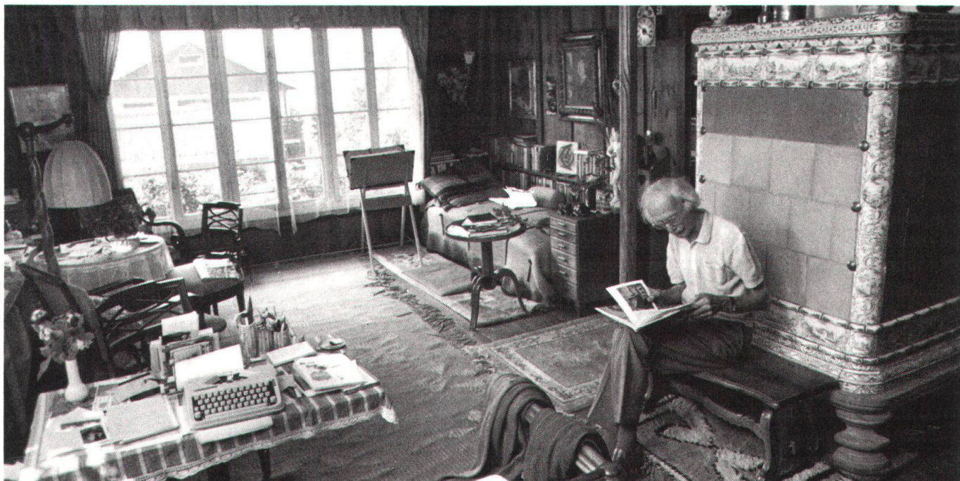
L'artiste qui quitte le «service de l'Ecu d'or» dans sa maison de Herrliberg.